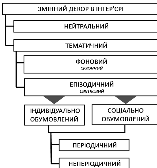
Рис. 2. Види змінного декору в інтер'єрі

проміжки часу (до прикладу, релігійні свята чи дні народження), або неперіодичним, якщо подія, до якої створюється декор, є унікальною, наприклад, весілля, хрестини, ювілеї або визначні державні чи суспільні епізоди (рис. 2).