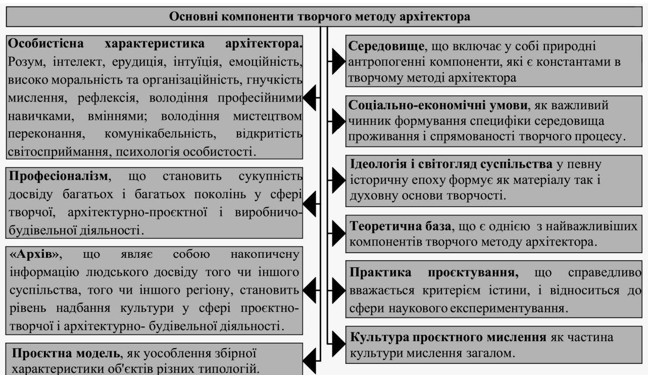
Рис. 2. Основні компоненти творчого методу

Еволюційний розвиток кількісно-якісних показників змісту творчого методу архітектора відповідає загальній теоретичній системі, через засадничі поняття: нуль – система – об’єкт – система – система об’єктів – абстрактна система. Найактуальнішим завданням є формування творчої методу архітектора як об’єкта-системи, який має відповідати наступним умовам: