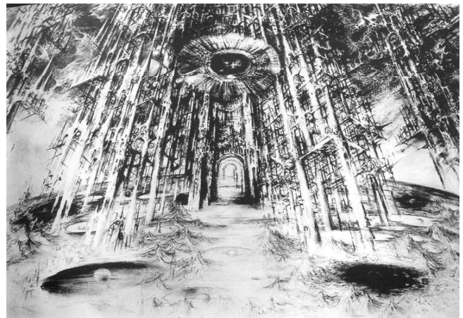
Рис. 4. Ескіз декорації до опери “Лоенгрін”