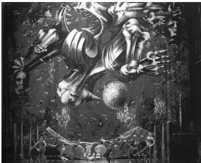
Рис. 1. Завіса до "Створення світу". "Третє коло пекла"