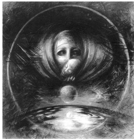
Рис. 2. Ескіз декорацій до "Створення світу"

Балет "Ромео і Джульєтта" супроводжує музика Сергія Прокоф'єва – яскравого композитора ХХ ст., стиль якого надзвичайно новітній і відмінний від класичного літературного твору, який написав Вільям Шекспір у кінці XVI ст. Є. Лисик, разом з балетмейстером М. Заславським, намагалися досягти єдності із музикою композитора, костюмами та декораціями і створити нову постановку, відповідну ХХ ст. У ескізі сценографічного вирішення завіси показано дві стіни, що набрані певною кількістю стовпів-елементів, які символізують два світи ворогуючих родів Монтеккі та Капулетті. Там, у відкритому просторі, де захисту немає, між людьми точиться боротьба. Коли вона вшухає, кожен буде ховатися за своєю стіною, готуючи нові баталії. Сильні почуття Ромео та Джульєтти ніби закуті у просторі забудови Верони, але не ренесансного мереживного міста, а умовно спрощеного і геометризованого, що підсилює відчуття трагедії героїв. Використання перспективи підсилює розуміння сюжету цієї життєвої драми – їй немає кінця і в ній немає сенсу (рис. 3) (В. Проскураков, О. Зінченко, З. Климко ред., 2005. Обкладинка).