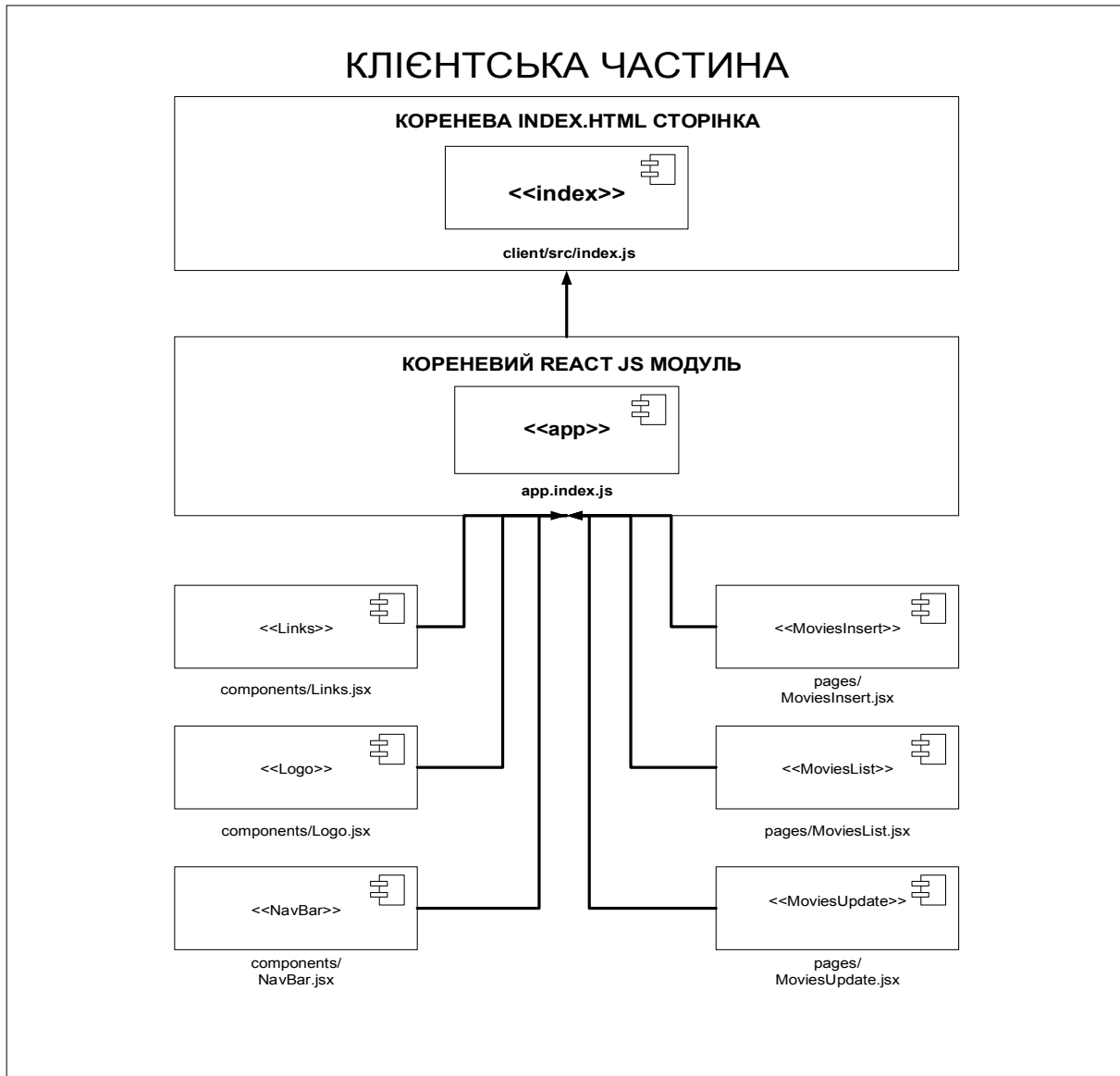
Рис. 2. Архітектура клієнтської частини