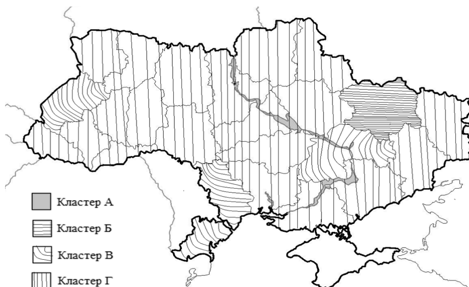
Рис. 2. Картограма поділу регіонів України на кластери за розподілом кількості ЗВО і кількості студентів у 2019/20 навчальному році

більший, у нього входить 20 регіонів (42 % ЗВО України). Розрахункові значення коефіцієнта концентрації, обчислені для показників кількості ЗВО і кількості студентів (0,38 і 0,39 відповідно), свідчать про помірний рівень концентрації у трьох кластерах (А; Б; В), у яких коефіцієнти локалізації для кількості ЗВО (5,8; 2,8; 2,0) і кількості студентів (6,4; 3,0; 1,8) перевищували 1. Це свідчить про наявність регіональних асиметрій у вищій освіті України.