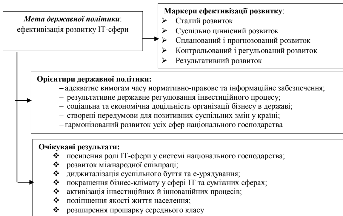
Рис. 4. Мета, маркери, стратегічні пріоритети та результативність державної політики розвитку ІТ-сфери