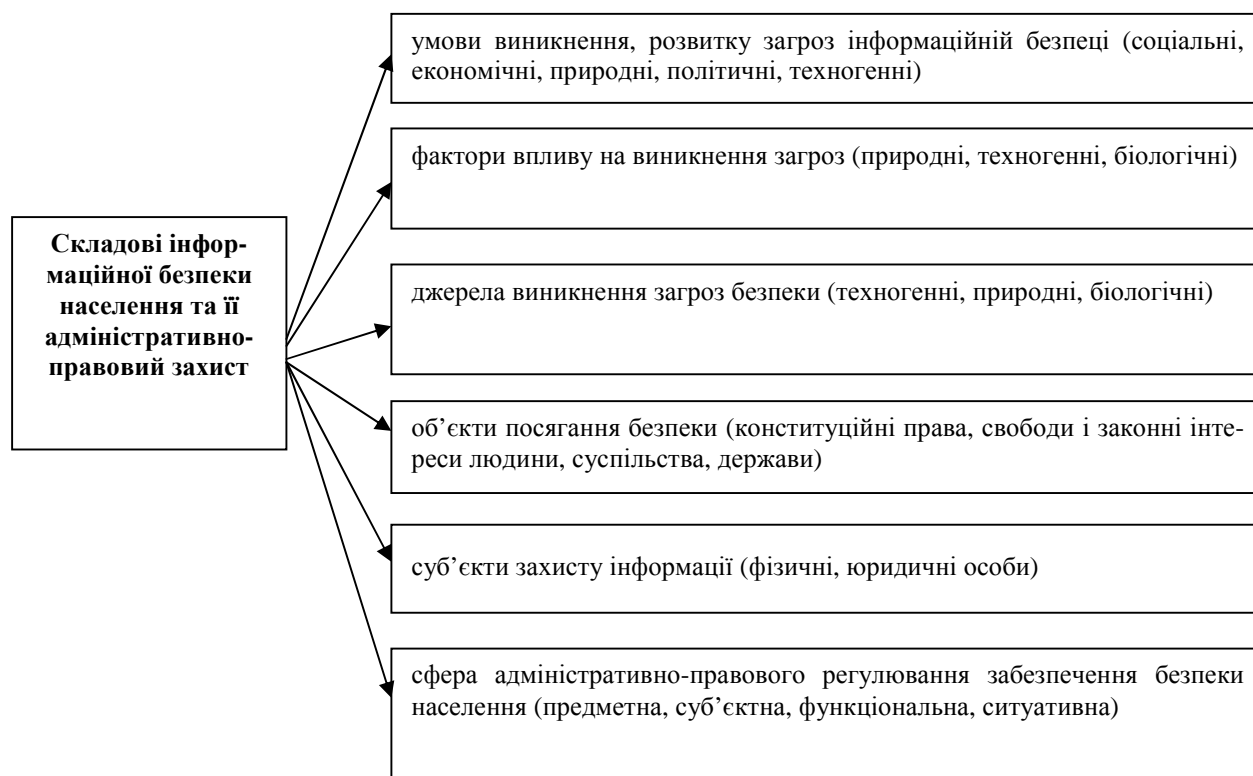
Рис. 1. Структурно-логічна схема безпеки у сфері адміністративно-правового регулювання

Адміністративне право, як одна із основних галузей права, є важливим правовим інструментом протидії та захисту відносин у сфері інформації шляхом застосування адміністративно-правових заходів відповідальності за їх порушення. Звернемо увагу на низку термінів, які характеризують відносини у сфері інформації. Серед них найпоширенішим є термін “інформація”, який пропонують розглядати в загальному розумінні як відомості про які-небудь події, ситуації, чинючу діяльність [14, с. 828; 15, с. 153; 16, с. 282]. Інформацію в правовому аспекті розуміють як об'єкт права – будь-які відомості та/або дані, які мають бути збережені на матеріальних носіях або відображені в електронному вигляді (ст. 1 Закону України “Про інформацію”) [17, с. 355; 18, с. 264; 19, с. 717; 20, с. 123].