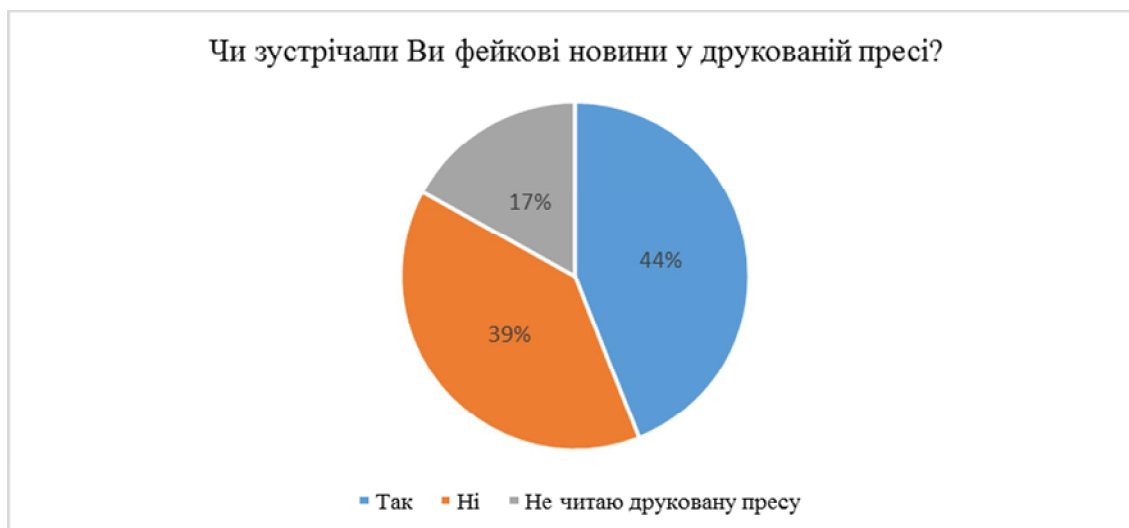
Рис. 3. Частка дорослих, які стали свідками фейкових новин у друкованих ЗМІ в усьому світі

Однак, хоча кримінальне законодавство не поширюється на плагіат, в деяких випадках воно може призвести до судового розгляду на іншій основі. Принципи законодавства про авторське право диктують, що виробництво, спроба або фактичний продаж чи найм, розповсюдження або торгівля будь-якими матеріалами, що порушують права, становитимуть кримінальне правопорушення за умови, що особа знала про те, що твір порушував (або містив) матеріал, який порушує права. Отже, коли користувач вчиняє навмисний плагіат і продовжує займатися цим твором, елементи кримінального порушення авторських прав (а не крадіжки) виконуються [20].