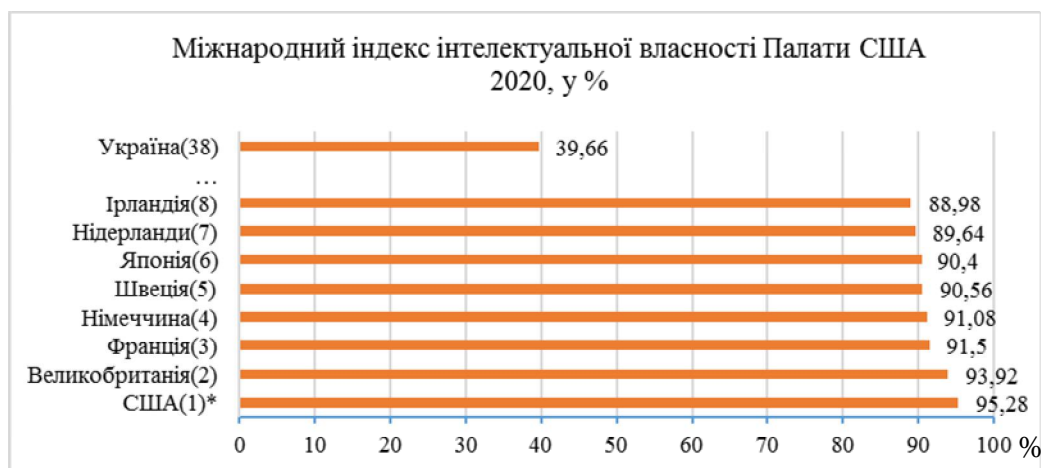
Рис. 2. Міжнародний індекс інтелектуальної власності Палати США 2020, у % [23]

*Примітка: у дужках місце країни в загальному рейтингу.