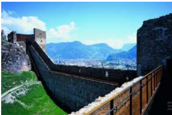
Рис. 5. Замок Зігмундскрон. Відтворені галереї з кородованого металу.