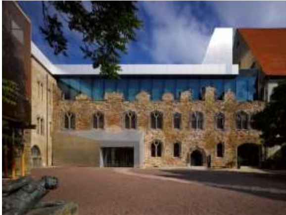
Рис. 11. Замок Морітцбург. Північне крило після реконструкції.

місці втраченої південно-західної вежі, як сучасна прибудова покрита алюмінієм. Зовні, чотирикутний в плані замок з вежами по кутах, має середньовічний образ; з внутрішнього двору північне та західне крила у готичному стилі, а південна та східна сторона – складаються з окремих об'єктів: резиденції, каплиці та Талхаузу, що примикають до оборонних мурів. Саме з внутрішнього двору відчувається вплив XXI століття: скляна стіна на місці третього зруйнованого ярусу північного крила, втоплена вглиб, відкриває необроблені фрагменти стін з кам'яної кладки (Рис. 11).