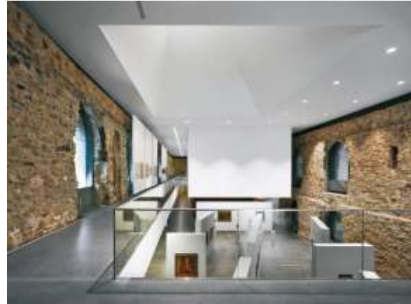
Рис. 12. Замок Морітцбург. Інтер'єр адаптований під художній музей. (Фото: Roland Halbe https://www.archdaily.com/132838/moritzburg-museum-extension-nieto-sobejano-arquitectos ).

Замок Бленсов Хол (Blencow hall, Cumbria, England) побудований у XVI століття. 1800 року перебуваючи у стані руїни став приватною власністю родини Роулі, що опікується ним і сьогодні (The Rowley estates, 2012). Замок представляє собою дві вежі з'єднані між собою корпусами будинків. Проект реконструкції об'єкту розробляло архітектурне бюро Donald Insall Associate в кооперації з місцевим архітектором Гремом Норманом, реалізовано у 2008 році.