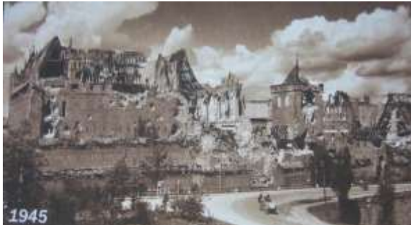
Рис. 7. Замок Мальборк. Стан після Другої Світової Війни, 1945р. ( https://infmir.ru/articles/poland_malbork/ )

відбудова зруйнованих будівель та консервація інтер'єрів. Масштабні кваліфіковані роботи були оцінені і замок включили до Списку Всесвітньої спадщини ЮНЕСКО, як найбільший у світі фортифікаційний об'єкт збудований із цегли. Реставраційні роботи ще тривають, а замок успішно функціонує як музей.