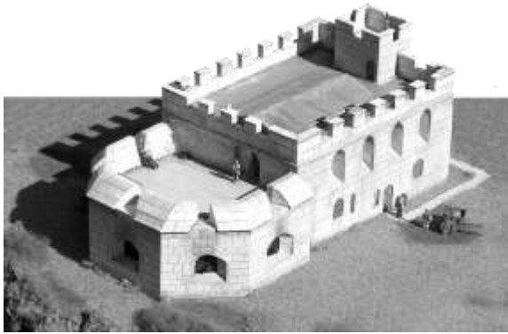
Рис. 15. Замок Сендсфут. 3D-реконструкція на період заснування у XVI ст. ( https://www.sandsfootcastle.org.uk/sample-page/?fbclid=IwAR1a61_Kw7IDChv5xLHy7fqoVQ_E2sOC0zcUnlD_gqBveVg8oVs7d4T6z7s ).

Замок Сендсфут (Sandsfoot castle, Weymouth, England) – об'єкт берегової оборони, один із 21 прибережних замків закладених за час правління Генріха VIII, побудований в період 1539-1541 років (Sandsfoot, 2016). Являв собою двоповерхову споруду з підвалом (Рис.15), основне завдання якої – відстежувати кораблі, що наближаються. Не мав традиційних оборонних елементів замку, так як не призначався для наземного бою, передбачав віддалений гарматний бій. Був покинутий та почав руйнуватися ще до початку XVIII ст. У 2009-2012 роках були проведені роботи по виведенню об'єкта з аварійного стану. Проект розробила архітектурна фірма Levitate (Mull O., 2014). В рівні другого поверху – фрагментарна реставрація облицювальної поверхні стін, в решті об'єму – консервація (Рис.16).