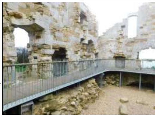
Рис. 18. Замок Сендсфут. Внутрішній простір.