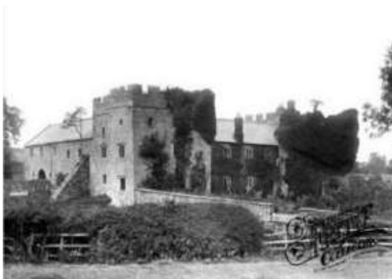
Рис. 13. Замок Бленсов Хол. Фото 1893 року. (The Rowley estates, 2012).

Замок Бленсов Хол (Blencow hall, Cumbria, England) побудований у XVI століття. 1800 року перебуваючи у стані руїни став приватною власністю родини Роулі, що опікується ним і сьогодні (The Rowley estates, 2012). Замок представляє собою дві вежі з'єднані між собою корпусами будинків. Проект реконструкції об'єкту розробляло архітектурне бюро Donald Insall Associate в кооперації з місцевим архітектором Гремом Норманом, реалізовано у 2008 році.