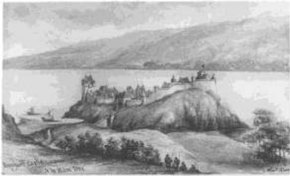
Рис. 21. Замок Уркхарт. Графічна реконструкція. ( Mackay, 1914; https://www.thecastlesofscotland.co.uk/the-best-castles/scenic-castles/urquhart-castle/ ).