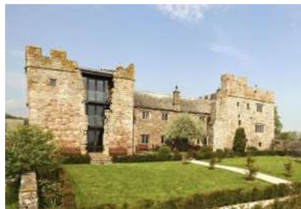
Рис. 14. Замок Бленсов Хол. Сучасний вигляд з реконструкцією «розлому» південної вежі (Re Developer, 2019).

Проект передбачав пристосування замку під готель. Південну вежу, що мала тріщину у зовнішній стіні (Рис.13), прийняли рішення не відтворювати у повному об'ємі, так як «розлом»