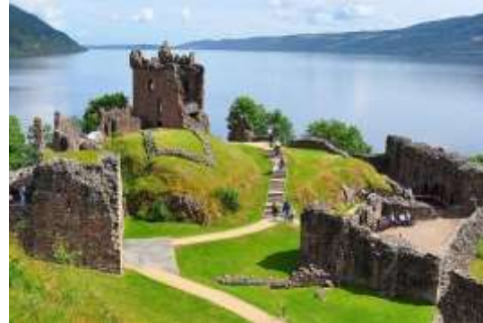
Рис. 22. Вигляд замку Уркхарт сьогодні.