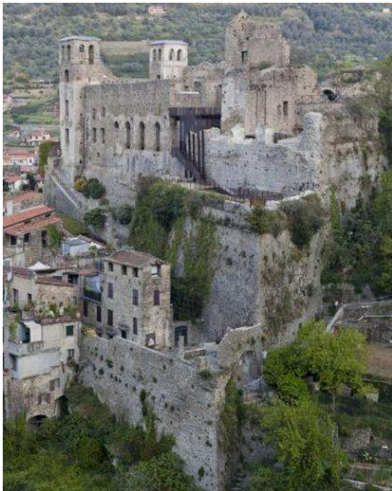
Рис. 1. Замок Дольчеаква. Загальний вид. Фото з дрону.

Замок Дольчеаква / замок Дорія (Dolceacqua, Liguria, Italy) XII століття, що розташовується на височині, з видом на середньовічне місто, – великомасштабна руїна, збережена об'ємно-просторова структура. Гарний приклад музеєфікації архітектурної культурної спадщини (The Plan, 2016). Був сильно пошкоджений під час воєнних дій і в результаті покинутий 1744 року, а 1887 року землетрус завдав додаткових руйнацій. Перші реставраційні роботи були проведені у 1990-их, у 2012-2015 роках продовжилися: реставрація кам'яної кладки, очищення від біонаростів, заповнення тріщин. Оновленню підлягали відкриті простори довкола, включаючи зелений громадський простір у підніжжі, облаштування транзитних шляхів, що спрямовували відвідувачів до точок огляду з неймовірними пейзажами (Рис.2). Замок доповнено елементами виконаними із кородованого металу: заповнення дверних прорізів, місця відпочинку, конструкції сходів та галерей, що надають можливість оглянути замок під іншим кутом зору. Впроваджені форми гармонійно вписуються в середовище, доповнюючи об'єкт елементом сучасності та не створюючи бутафорії. Над проектом працювало архітектурне бюро LDA+SR Studio (Archello, 2016).