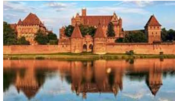
Рис. 8. Замок Мальборк. Фото: Калина Гаврилів, 2012

Замок Морітцбург (Moritzburg castle, Halle, Germany). Період заснування припадає на кінець XV – поч. XVI ст, функціонує як оборонна споруда разом із резиденцією. З XVII по XIX століття після тридцятилітньої війни перебуває у стані руїни. З 1900-их років розпочинаються роботи по адаптації замку під художній музей (Dezeen, 2017). У південному крилі на місці зруйнованих приміщень спорудили репліку старого «Thalhouse», що розташовувався на площі Холлмаркт. Сучасного вигляду замку надала остання перебудова у 2005-2008 роках, під керівництвом іспанського архітектурного бюро Nieto Sobejano Arquitectos. Північне та західне крила середньовічного замку були покриті алюмінієвим дахом неправильної форми (Рис.10), що не перевищував існуючих мурів і не порушував силует автентичної споруди. Конструкція має передбачені світлові ліхтарі, що природнім образом освічують експозицію інтер'єру.