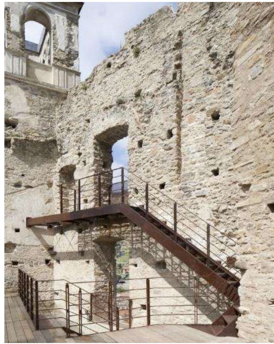
Рис. 2. Замок Дольчеаква. Впроваджені конструкції з кородованого металу.

Замок Зігмундскрон (Sigmundskron castle, near Bolzano in South Tyrol, Italy) згадується ще у X столітті. В кінці XV ст. значно укріплений, та вже з XVI ст. починає занепадати. Від 1996 року перебуває у власності провінції Больzano. 2006 року тут відкрито гірський музей MMM Firmian (Messner Mountain Museum Firmian). Ідея музею належала Рейнгольду Месснеру. Він мав на меті розповісти історію про те що відбувається всередині нас під час підкорення вершини: про небезпеку, про велич та таємничість гір (музей MMM – це мережа з шести об'єктів, три з яких замки) (Italian ways, 2013). Над проектом працював архітектор Вернер Цхол: впровадивши сучасні елементи – зберіг первісний вигляд замку. Реставраційні роботи проводилися в період