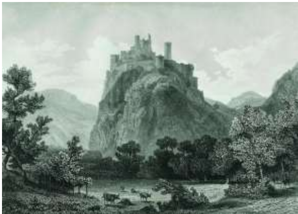
Рис. 3. Замок Зігмундскрон. Графіка, 1842 р. (Messner Mountain Museum, 2015).

2003-2006 років. Впритул до внутрішніх мурів замку споруджено новий об'єм, що ззовні має навісну сітчасту контструкцію з кородованого металу: сітка створює елемент мерехтіння, що візуально облегує об'єм, а також вказує на сучасний період будівництва, відділяючи в такий спосіб його від середньовічного замку. Колись дерев'яні оборонні галереї на оборонних стінах відтворенні з металу (Рис.5), слугують чудовим туристичним маршрутом для споглядання міста, що розкинулося під горою на якій височить замок. Покриття замкових веж не відтворювали – законсервували існуючий стан, дещо вирівнявши завершення стін, влаштували скляні дахи, які не видно ззовні. Нова архітектура залишається на задньому плані і слугує лише сценою для виставки (Messner Mountain Museum, 2015). Архітектор обмежив свій вибір матеріалів сталлю, склом та металом, які є сучасними та позачасовими водночас.