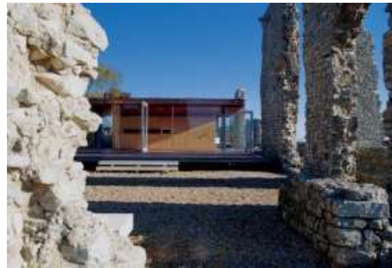
Рис.20. Чайний будиночок на території замку Монтемор-о-Вельйо (Ribeiro J., 2015).

Замок Уркхарт (Urquhart castle, Scotland). Руїни замку XIII століття розташовані на березі озера Лох-Несс. Останні воєнні дії на території замку відбулися в кінці XVII століття, коли захисники замку не в змозі стримувати противника підірвали об'єкт і покинули його (Historic environment Scotland, 2016). 1913 року держава ініціювала реставраційні роботи: руїни замку було законсервовано, облаштовано доріжки для зручності пересування туристів по території, у вцілілій вежі розташовано лапідаріум. Поруч, на початку XXI століття, збудовано центр для відвідувачів з кафе та автостоянкою (рис. 23-24).