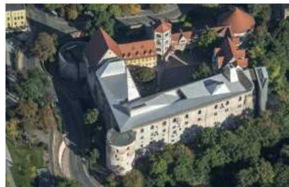
Рис. 10. Вигляд замку Морітцбург після реконструкції.

Ще одним цікавим рішенням став верхній ярус споруди у вигляді білих кубів (Рис.12), що прикріплені до новоствореної металевої платформи і надвисають у інтер'єрі так, що потрапити до них можна по галереях влаштованих попри зовнішні стіни замку. Проект доповнено двома вертикальними комунікаційними центрами: перший знаходиться у північному крилі, а інший на