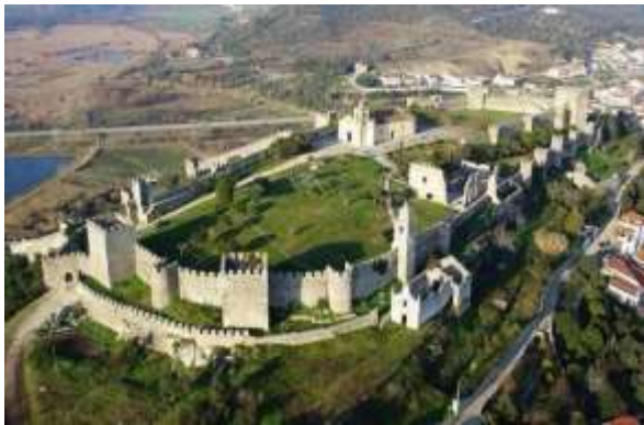
Рис.19. Замок Монтемор-о-Вельйо сьогодні.