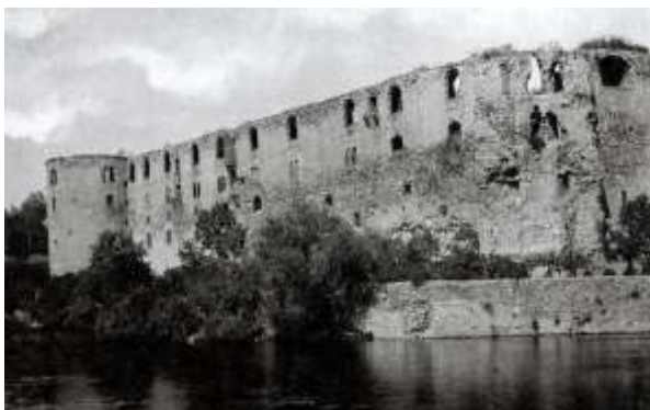
Рис. 9. Замок Морітцбург. Фото західного крила 1950 рік. ( https://www.kunstmuseum-moritzburg.de/en/museum-exhibitions/moritzburg-castle/#collapseBox-1316 ).

Замок Морітцбург (Moritzburg castle, Halle, Germany). Період заснування припадає на кінець XV – поч. XVI ст, функціонує як оборонна споруда разом із резиденцією. З XVII по XIX століття після тридцятилітньої війни перебуває у стані руїни. З 1900-их років розпочинаються роботи по адаптації замку під художній музей (Dezeen, 2017). У південному крилі на місці зруйнованих приміщень спорудили репліку старого «Thalhouse», що розташовувався на площі Холлмаркт. Сучасного вигляду замку надала остання перебудова у 2005-2008 роках, під керівництвом іспанського архітектурного бюро Nieto Sobejano Arquitectos. Північне та західне крила середньовічного замку були покриті алюмінієвим дахом неправильної форми (Рис.10), що не перевищував існуючих мурів і не порушував силует автентичної споруди. Конструкція має передбачені світлові ліхтарі, що природнім образом освічують експозицію інтер'єру.