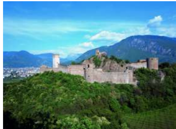
Рис. 4. Замок Зігмундскрон. Сучасний вигляд. (фото Alexa Rainer, https://www.archilovers.com/projects/93872/gallery?707344 ).