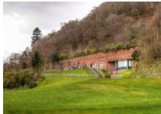
Рис.24. Будівля інфо-центру біля замку Уркхарт (фото: Mike Pennington; https://commons.wikimedia.org/wiki/File:Urquhart_CastleVisitor_Centre_-_geograph.org.uk ).

Замки Дольчеаква та Зігмундскрон виглядають спорідненими за архітектурним рішенням щодо ревіталізації об'єкта: масштабна руїна, консервація стін та мурів, влаштування елементів з кородованого металу. Але нововведені елементи, насправді, мають різний підхід відносно їх влаштування. У випадку замку Зігмундскрон – це відтворення оборонних галерей (Рис.5), а у Дольчеаква – можливість доступу на вищі рівні для огляду пам'ятки та виду з неї (Рис.2). В обидвох випадках архітектори використали кородований метал як матеріал для новостворених елементів, виконавши вимогу Венеціанської хартії «...всякі доповнення визначені необхідними з естетичних чи технічних міркувань, мають відрізнятися в архітектурній формі пам'ятки і нести ознаки нашого часу» (Венеціанська хартія, 1964).