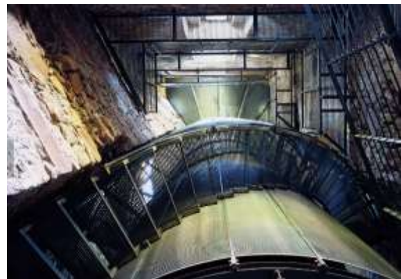
Рис. 6. Замок Зігмундскрон. Інтер'єр вежі. Влаштування сходів.

Замок Мальборк (Польща) заснований у XIII столітті. Готичний цегляний замок був резиденцією рицарів Тевтонського ордену (Mierzwinski M., 2009). У XVII столітті замок занепадає, та поціновувачі його архітектури збирають кошти на реконструкцію, яка почалася у 1816 році. Друга Світова Війна привела замок до стану руїни (Рис.7). Та польська влада знову розпочала відновлювальні роботи. Цікаво, що спершу було прийнято рішення щодо знесення будівлі, та згодом було змінено. Під час виконання робіт також були виправлені помилки зроблені під час попередньої реконструкції. Відновлення дахів та реконструкція склепінь,