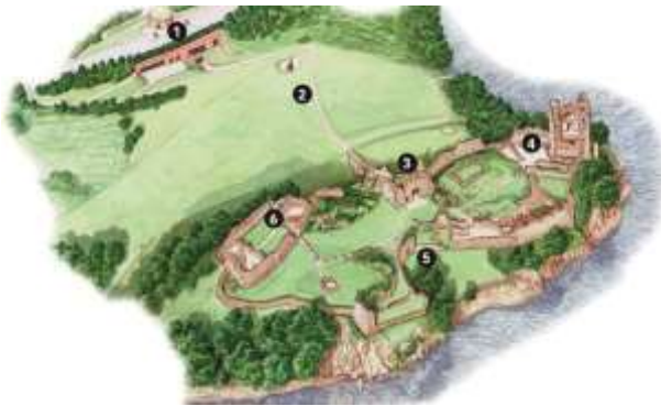
Рис.23. Схема розташування замку Уркхарт (3-6) та інфоцентру (1). (Historic environment Scotland, 2016).