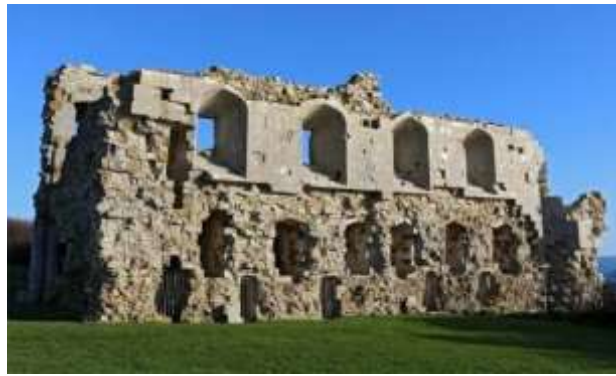
Рис. 16. Вид ззовні замку Сендсфут після відновлювальних робіт у 2012 році.