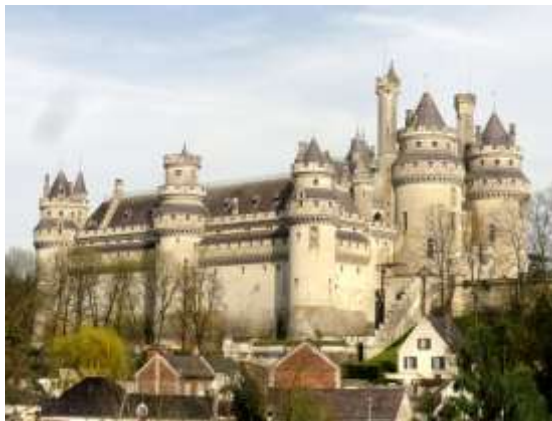
Рис.4. Замок П'єрфон, фото, 2013 р.