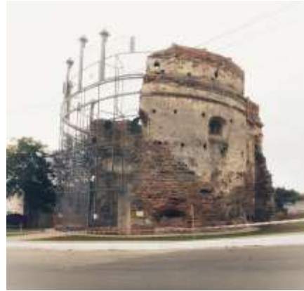
Рис.18. Арт-простір «Культурний Барбакан» (Рівне 1, 2018)