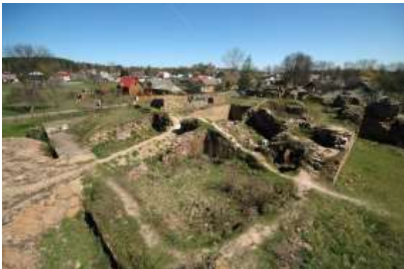
Рис.15. Замок в Іновлодзю до реставрації Фото: ZeroJeden, 2007. ( Polskie zamki, 2007 )

Все ж об'єкт в руїні як кінцевий результат реставраційного втручання посідає своє законне місце. Цікавим прикладом є реставрація замку у містечку Іновлодзь ( zamek w Inowłodzu, Polska ), який занепадає з середини XVII ст. та розбирається на будматеріал. В XIX ст. ще збережені фрагменти замкових мурів практично зрівнялися із землею. В 1970-их роках розпочалися археологічні розкопки, руїни законсервували. В період 2011-12 років замок був частково відбудований, проте залишений у стані руїни: втручання було доти, доки достовірно знали попередній вигляд. В результаті замок став центром культурного життя містечка та поштовхом до його розвитку. Замкова руїна наповнилася центром для відвідувачів, невеличкою бібліотекою та приміщенням для проведення навчань і конференцій. Послугами замку користуються як туристи так і місцеві мешканці, є доступ і для людей з обмеженими можливостями (Latosinska, 2015).