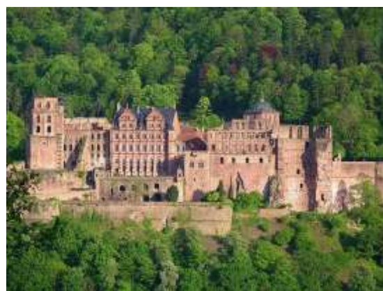
Рис.8. Гайдельберзький замок станом на 2005 р. ( Wolf, 2005 )

Полеміки між прихильниками стилістичної та археологічної реставрації тривали роками – вони вбачали цінність у різних субстанціях пам'ятки. Прибічники археологічної реставрації вболівали за матеріальну структуру пам'ятки, стилісти ж вбачали красу у