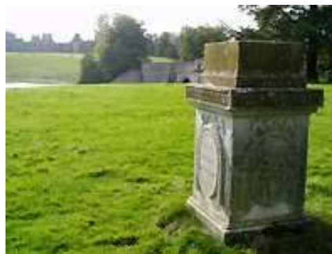
Рис. 2. Пам'ятний знак на місці зруйнованого замку Вудсток. (Pipe S., 2007)