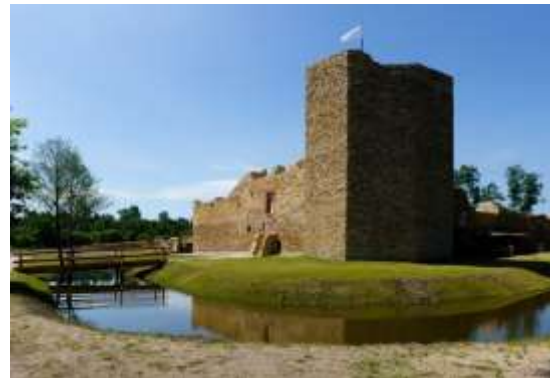
Рис.16. Замок в Іновлодзю. ( Bednarek, 2013 )

На представлених прикладах спостерігаємо, що ряд хартій, які рекомендували обмежувати втручання в матеріальну структуру архітектурних пам'яток, не працювали як годиться. Суспільство надає перевагу завершеним об'єктам, які є для них зрозумілими. Тож у 2000 році ухвалили Ризьку хартію, що допускала реконструкцію на пам'ятках, проте регламентувала її, ставивши основний наголос на чіткій відмінності доповнюючих матеріалів від автентичних.