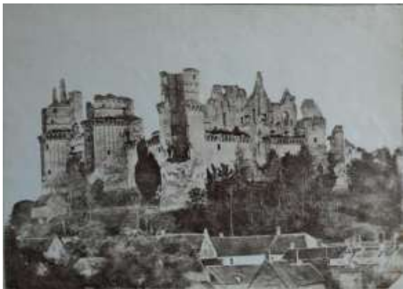
Рис.3. Замок П'єрфон до реставрації, архівне фото, 1870 р. (Galerie Michel Cabotse, 2009)

відбудувати її в завершеному вигляді, який, можливо, ніколи раніше не існував» (Віолле-ле-Дюк, 1937). Він вважав, що будівля має бути завершеною і не будував гіпотез стосовно того, як замок міг би виглядати раніше: минуле було втрачене, а знання про нього - відсутні. Віолле-ле-Дюк став співавтором невідомого архітектора, що керував будівництвом первісного замку п'ять століть до нього. Незважаючи на гучну критику, стилістичні реставрації поширилися Європою.