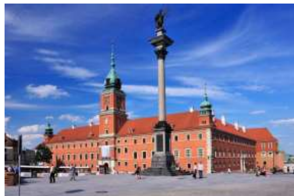
Рис.10. Королівський замок у Варшаві у XXI ст.

Зруйновані пам'ятки архітектури знову накриває хвиля відбудов. Для прикладу розглянемо змок у місті Тракай ( Trakų salos pilis, Lietuva ). Початок його будівництва припадає на кінець XIV ст., та вже з XVII ст. починає занепадати та перетворюється в руїну. В 1888 р. були проведені обміри та зафіксовано стан споруди. Царський уряд дав команду