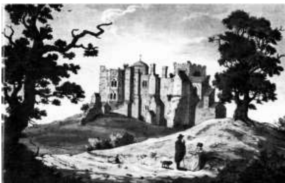
Рис. 1. Замок Вудсток. Автор невідомий, акварель, поч. XVIII ст. (Pipe S., 2007)

вони допомагають сформувати та збагатити пейзаж. Це були початки становлення розуміння цінності історично сформованого середовища. Проте 1720 року руїни розібрали (Jokilehto, 1986). Місце, на якому колись розташовувався замок, сьогодні позначено постаментом.