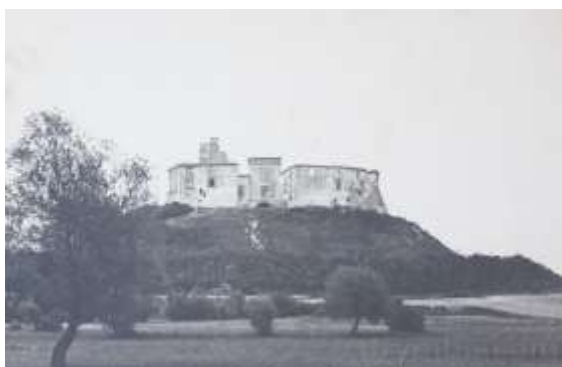
Рис.5. Олеський замок в стані руїни, архівне фото, 1950-ті р. (Andrij, 2018)

Західноєвропейська культурна атмосфера вплинула і на реставраційну діяльність на території України. Прихильником даної неоромантичної концепції реставрацій був архітектор та реставратор Юліан Захаревич (1837-1919 рр.). У 1882 році він входив до складу комісії, яка визнала Олеський замок, що на той час перебував в стані руїни, придатним до реставрації. Ю. Захаревич разом із Л. Вежбицьким розробляли проект реставрації замку. Проте роботи на об'єкті обмежилися лише його виведенням з аварійного стану, подальші реставраційні роботи проводилися 1933 р. під керівництвом В. Мінкевича, далі після Другої світової війни розробкою проекту пристосування замку під музей займалися Львівські реставраційні майстерні під керівництвом І. Могитича. Роботи з реставрації інтер'єрів тривали до 1975 року, після чого замок був відкритий для відвідувачів (Бевз, 2018). Останнім керівником реставраційних робіт на замку був Б. Возницький. Як результат, замку було повернуто вигляд на період його найбільшого розквіту – кінця XVIII ст. Реставрація, яка почалася у кінці XIX ст., не зважаючи на розтягнутість у часі, все ж завершилася повною відбудовою об'єкта.