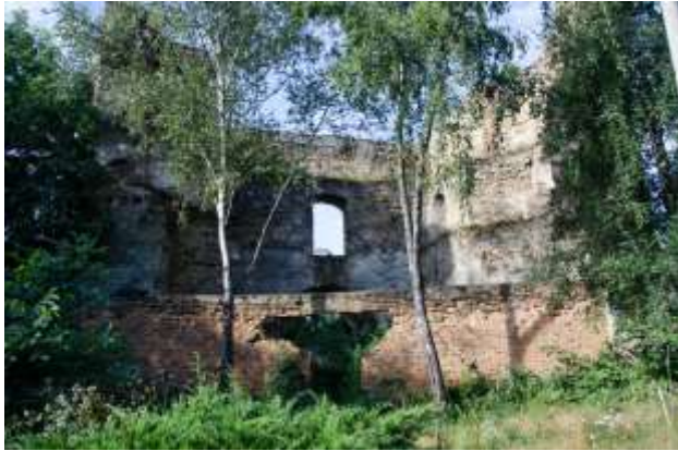
Рис.17. Татарська вежа, фото, 2017. (Державний історико-культурний заповідник міста Острога, 2017)