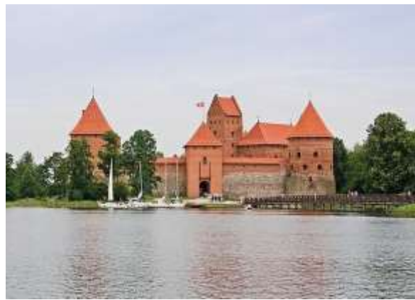
Рис.12. Тракайський замок. (Mottl, 2008)

Верхній замок у Вільнюсі ( Vilniaus Aukštutinė pilis, Lietuva ) мав всі шанси повторити долю Тракайського. З XVI ст. через втрату оборонної функції, як і в більшості литовських замків, припиняють підтримувати належний технічний стан споруди. У XVIII ст. в замку почалися руйнівні процеси, спричинені в тому числі і руйнуванням гори Гедиміни, на якій він розташовувався. У XIX ст. була проведена консервація автентичної кладки та відбудована одна з веж, яку адаптували під музей. За рахунок розташування на узвишші зі складною геологічною структурою, він уникнув у XX ст. повної відбудови. Сьогодні і далі ведуться дискусії, чи повинен замок бути збережений у вигляді руїни, чи його таки слід відбудувати у легких конструкціях, щоб реконструювати силует міста (Povilaityte, 2016).