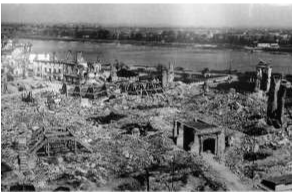
Рис.9. Руїни Королівського замку у Варшаві після бомбардування 1944р., архівне фото, 1947р. (Polska-org, 2018)

Та історія вносить свої корективи: друга половина XX ст. після великих втрат під час Другої світової війни спричинила повернення до теми цілісної відбудови, проте на науково обґрунтованих засадах. Повна відбудова замкової руїни у XX ст., що була визнана науковою спільнотою та внесена до Переліку Всесвітньої культурної спадщини ЮНЕСКО, належить руці реставратора Яна Захватовича ( Jan Zachwatowicz, 1900-1983 ). Бомбардування 1944 р. зрівняли Королівський замок у Варшаві ( Zamek Królewski w Warszawie, Polska ) із землею (Рис.9). Ян Захватович стверджував: «Не маючи змоги погодитися зі знищенням наших пам'яток культури, будемо їх реставрувати, будемо відбудовувати їх від підмурків, щоб передати нащадкам якщо не автентичну, то хоча б точну форму їх, живу у нашій пам'яті і приступну в матеріалах [...] Звичайно, в шляхетній реставраційній науці це є кроком назад на кілька десятків років, однак на нашому ґрунті є єдиним можливим шляхом розвитку» (Zachwatowicz, 1946). Замок, який ми спостерігаємо сьогодні у центрі Варшави, є новою спорудою, збудованою в період 1971-1984 років. Маючи всі необхідні дані про вигляд втраченого об'єкта, вдалося відтворити його точну копію.