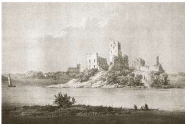
Рис.11. Тракайський замок в стані руїни. Наполеон Орда, літографія, 1883 р. (Orda, 1883)

підтримувати руїни та провести часткову відбудову, про повну реконструкцію мови не йшлося, оскільки іконографічні матеріали про вигляд замку були відсутні. Проте, коли у 1960-1970 роках виділили фінансування, Тракайський замок відбудували у повному об'ємі. Рішення про відбудову було аргументовано значенням замку для держави та нації, бажанням зберегти реліквії та відновити хоча б один із середньовічних замків Литви, створивши його образ, «яким би він міг бути» (Riaubiene, 2012). В даному випадку мала вплив загальна тенденція до відбудови в післявоєнний період, коли велика кількість пам'яток була втрачена.