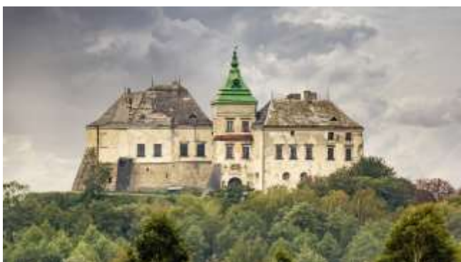
Рис.6. Олеський замок.

Стилістичні реставрації, результатом яких ставала ідеальна картинка, до кінця XIX ст. спричинили до появи кардинально протилежних методів реставрації – археологічних. Камілло Бойто (Camillo Boito, 1836-1914), італійський архітектор та мистецтвознавець,