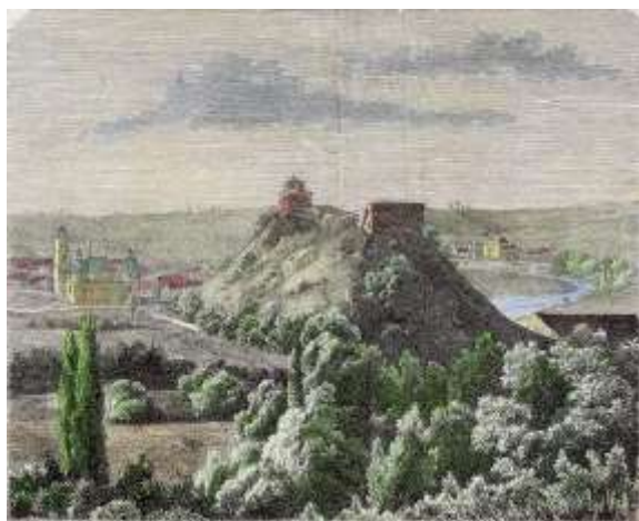
Рис.13. Вид на верхній замок у Вільнюсі. Julian Ceglinski, ксилографія, 1861р. (Tygodnik Ilustrowany, 1861)

Верхній замок у Вільнюсі ( Vilniaus Aukštutinė pilis, Lietuva ) мав всі шанси повторити долю Тракайського. З XVI ст. через втрату оборонної функції, як і в більшості литовських замків, припиняють підтримувати належний технічний стан споруди. У XVIII ст. в замку почалися руйнівні процеси, спричинені в тому числі і руйнуванням гори Гедиміни, на якій він розташовувався. У XIX ст. була проведена консервація автентичної кладки та відбудована одна з веж, яку адаптували під музей. За рахунок розташування на узвишші зі складною геологічною структурою, він уникнув у XX ст. повної відбудови. Сьогодні і далі ведуться дискусії, чи повинен замок бути збережений у вигляді руїни, чи його таки слід відбудувати у легких конструкціях, щоб реконструювати силует міста (Povilaityte, 2016).