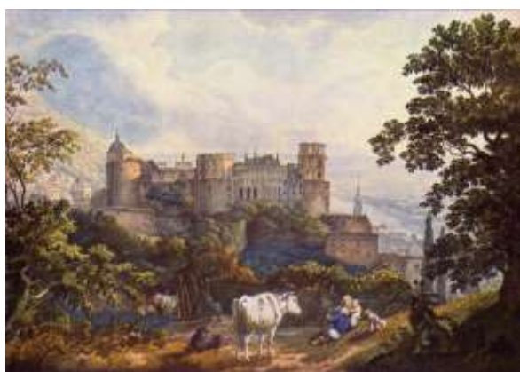
Рис.7. Гайдельберзький замок. Karl Philipp Fohr, полотно, олія, 1815р. ( The Yorck Project, 2002 )

Гайдельберзький замок ( Heidelberger Schloss, Deutschland ) класифікується як руїна після воєнних дій в кінці XVII ст. Безуспішними були як спроби його відбудови, так і ідеї розібрати на будматеріал. Тут і були втілені ідеї археологічної реставрації. В кінці XIX ст. розроблено проект, який передбачав консервацію замкових руїн. Реставрацію було передбачено лише на споруді, яка була понищена пожежею, але не зруйнованою. У комісію, що визначила долю збереження замку як руїни, входив Вільгельм Любке ( Wilhelm Meyer-Lübke, 1861-1936 ), який висловлювався: «Наша прага відновлення досягла небезпечної точки. Це стало лихоманкою, яка у своєму шаленстві ось-ось знищить розкішні пам'ятки наших предків» (Lübke, 1861). Лихоманку почали лікувати – на перше місце виходить ідея недоторканності пам'ятки, а Гайдельберзький замок сьогодні гордо носить звання найбільших руїн в Німеччині.