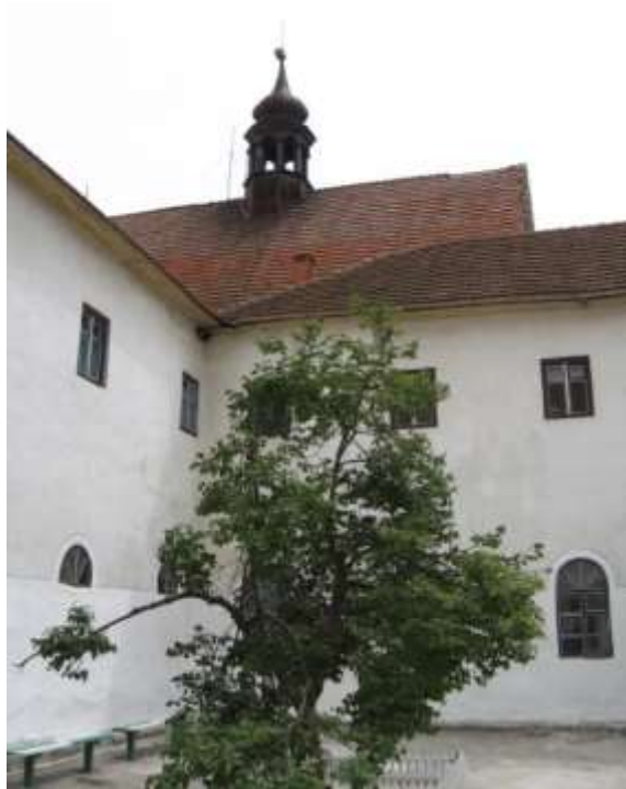
Рис. 12. Дворик монастиря. Фото автора 2012 р.