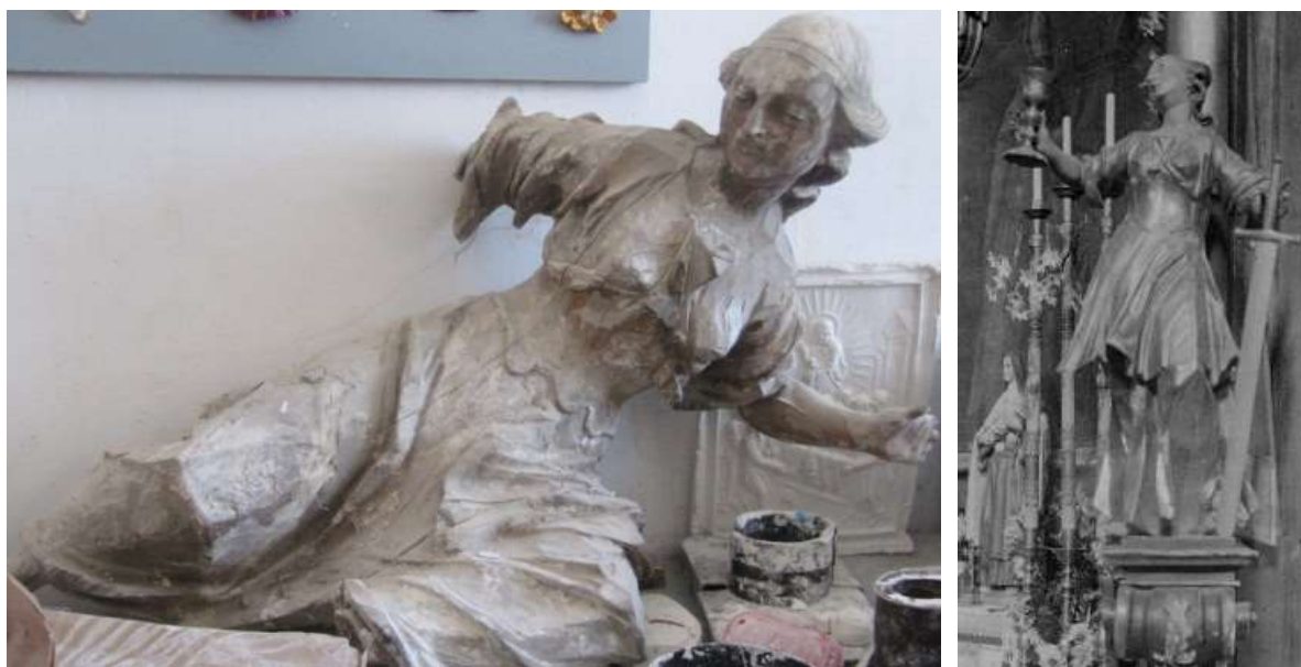
Рис. 5. Збережений фрагмент дерев'яної скульптури з вівтаря костелу.