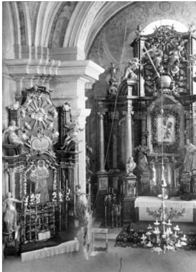
Рис. 3. Центральний та боковий вівтарі з чудотворними образами – Матері Божої Фрагської (XVII ст.) й св. Антонія Падевського (XVIII ст.), роботи Георга Іоана Пінзеля, придворного мистця Стефана Потоцького та його дружини Іоанни з Синявських, тітки Софії Марії Чарторийської з Синявських.

Синявський отримав важкі рани і невдовзі, у січні 1684 р., помер (Maciszewski, 1910, s.114). Після смерті воєводи фундування будівництва продовжив його син Адам Микола Синявський, гетьман великий коронний, каштелян краківський. Однак активну добудову монастиря розпочато аж 23 вересня 1716 року. Того ж дня, львівський архієпископ Ян Скарбек (1713–1733) освятив костел. Але урочисте впровадження отців до кляштору відбулось ще пізніше – 8 серпня 1720 р. за участю архієпископа Яна Скарбека, що побував у Бережанах з канонічною візитацією. У 1724 р. добудовано ганки, сходи костелу і довершено внутрішню галерею, територію монастиря обведено муром. А в 1730 р. замінено дах костелу (Maciszewski, 1910, s.114). Отож, будова костелу і монастиря тривала 112 років. Спорудження, власне, монастиря завершено аж у 1742 році стараннями Софії Марії Чарторийської з Синявських (Ostrowski red., 2007, s. 128–129).