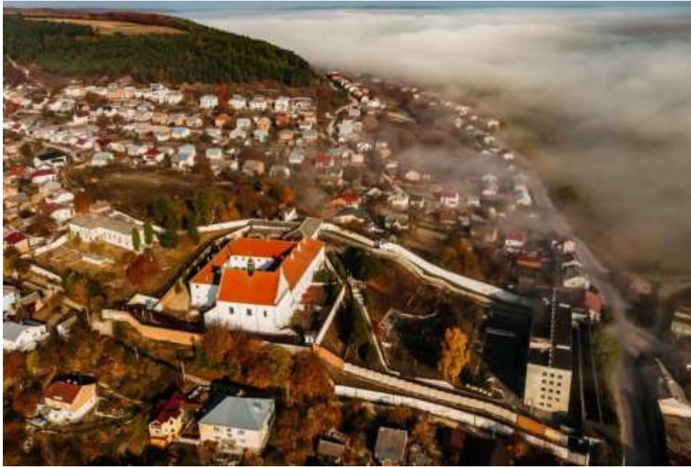
Рис. 11. Монастир з пташиного лету.