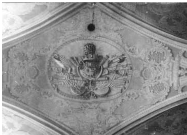
Рис. 8. Спарений гербовий щит Синявських-Любомирських на суфіті костелу Святого Миколая.