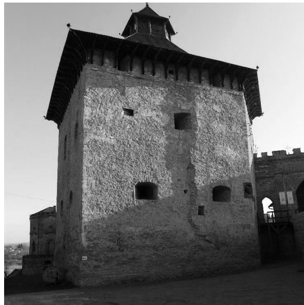
Рис. 2. П'ятикутна вежа, 2015 рік Освітлення виразно демонструє зміщення площин мурів після розлому башти

Однак, після переможної битви 1683 р. під Віднем польські загони з 1684 р. знов нападають на Поділля, повертається ситуація подібна до 1673-1676 рр., коли, окрім Кам'янця, решту Поділля османи фактично не контролюють (Kołodziejczyk, 1994, S.292). Контроль над Меджибожем османською владою також втрачається ще до 1699 р., про що свідчить наявність в архіві польського Інвентаря міста Меджибожа і Меджибізької волості (див. Klucz międzyboski...), який озаглавлено як «написаний в замку Меджибізькому року 1692 дня 2 листопада». Я. Столицький (1996, С.43) називає 1686 рік роком залишення Меджибожа турками та повернення до замку польської залоги.