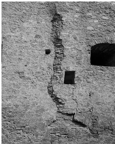
Рис. 3. Одна з розколин в мурі п'ятикутної башти, яку заповнено кладкою під час ремонту