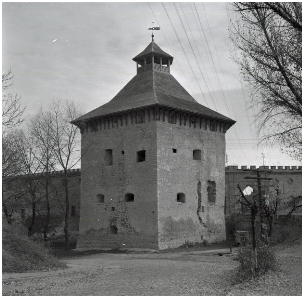
Рис. 1. «Лицарська вежа», 1983 рік

У фінальній частині передачі Поділля туркам «спустошені землі на північно-східному Поділлі комісари ділили не рушаючи з Меджибожа... 14 жовтня відбулося урочисте прощання, після чого комісари обох сторін роз'їхалися по домівках, а перед тим попередньо обмінялися копіями граничних протоколів» (Kołodziejczyk, 1994, S.101). Д. Колодзейчик зазначає, що лише врегулювання питання кордону дозволило турецькій владі приступити до створення адміністрації Поділля мирного часу.