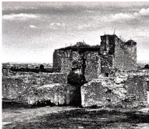
Рис. 3. Вид зруйнованої вхідної вежі з боку двору, фото до 2008 року.

На інші реконструкції замку звернув увагу Валентин Войцеховський: