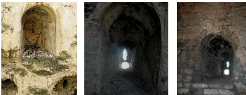
Рис.14. Внутрішній вигляд ніш із амбразурами.

Нові круглі артилерійські амбразури замінили собою вертикальні амбразури, яким відповідають ніші в стінах веж, трапецієподібні в плані і перекриті напівконічним склепінням, де висота ніші вища, ніж це було необхідно для амбразури нового типу. (Рис. 14).