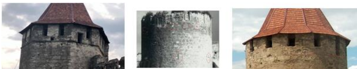
Рис.12. Башти замку з виходами на верхні галереї та «гнізда» від дерев'яних консолей. Фото Т. Нестеров 2008–2010.

Одними з найбільш категоричних аргументів про походження замку задовго до 1538 р. знаходяться у верхній частині веж, які не зачепили соціальних і природних руйнувань. Деталі, що збереглися, «гнізда» від консолей висячих галерей і отвори, що виходять на галереї - по три орієнтовані по краях світу, на кожному круглу вежу (Рис. 12.) і по одній на прямокутні вежі - оборонний фронт і ведення бою у верхній частині фортечних стін, техніка, використана до періоду застосування пороху та артилерії.