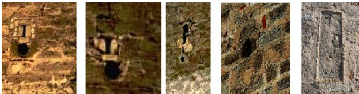
Рис.13. Артилерійські амбразури, що замінили більш ранні щілини для луку та стріл. Фото 2008–2010..

Більшість артилерійських амбразур складаються з двох кам'яних блоків: знизу з круглим отвором, зверху – короткий вертикально витягнутий отвір, використані з кінця XV століття – до першої половини XVI століття. Такі амбразури були використані в круглих і прямокутних вежах замку, але уважний аналіз кладки навколо амбразур виявляє, що вони вставлені в пробоїнах, оброблених різною майстерністю. (Рис. 13).