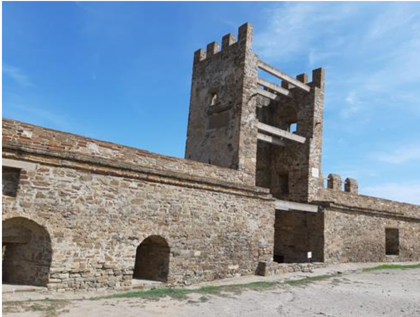
Рис.6. Генуезька фортеця, Судак, Крим. XIII-XIV ст.

Замки з напіввідкритими верхніми ярусами веж характерні для півдня Європи, збереглися у містах північної Італії, у Тоскані – Монтереджіоні, Веннето та інших регіонах, куди прибули італійські майстри, найпоширеніші у Криму, після венеціанської і генуезької колонізації - Судаку (Солдая) (Рис. 6), Феодісії (Каффа), Керчі (Воспоро) та ін.