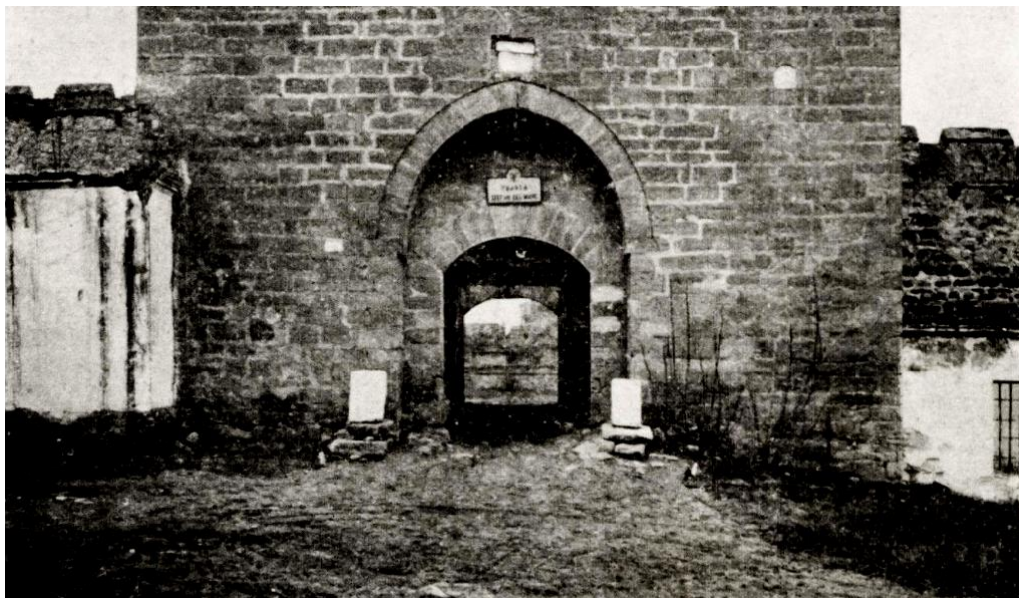
Рис. 1. Вхідна вежа зі стрілчастим порталом та лучковим входом у замок, 1918.

Один з найпереконливіших аргументів про більш раннє датування замку виводиться з технічних та архітектурних особливостей в'їзної вежі, аналіз яких заперечує її османське походження. Перший з них – стрілчаста форма вхідного порталю, характерна для готичної архітектури, стилістика, у ймовірний період будівництва замку в архітектурі Молдови та навколишніх країн поступалася місцем архітектурі епохи Відродження. Усередині порталю є менший дверний отвір з лучковою аркою, виконаний з клинчастого каміння, що є конструктивний прийомом, характерним для османської архітектури (Рис. 1).