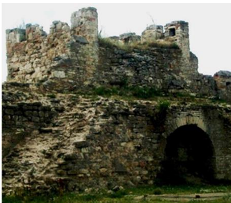
Рис.5. Західна вежа із забудованою стіною, повернутою до двору, фото 2008 р.

що не відповідає досить скромній архітектурі замку. Після повернення у 2008 р. Тігінського замку як об'єкта культурної спадщини, стало видно, що прямокутні вежі по середині куртин позбавлені стіни, зверненої у подвір'я, а три стіни вежі були значно тоншими, ніж зазвичай у фортецях Північного Причорномор'я. (Рис. 5).