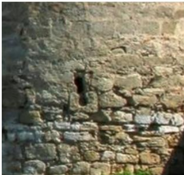
Рис.10. Нижня частина стіни Північно-західної вежі, з оголеною кладкою через довге перебування у воді.

На цих історичних фотографіях зафіксовано втрачений етап історії замку Тігіна, коли перед входом (як і вздовж усіх стін замку) був влаштований рів, перехід через який був можливий лише підйомним мостом. Нижня частина стін замку з каміннями, що впали, кладки і розчинів шви, створює враження довгого перебування у воді. (Рис. 10)