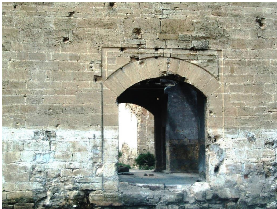
Рис.18 Верхня фортеця, турецька вежа, лучкова оттоманська арка, Фото 2008 р.

датовані до 1478 р. Від Верхньої Фортеці збереглася вежа, на якій спиралися крани підйомного мосту, відзначеного Евлією Челебі у 1657 р., в архітектурі вежі присутні деталі, які можна охарактеризувати як османські: вхідний портал з лучковою аркою з клинчастих каменів з зигзагоподібними бічними постілями. (Рис. 18)