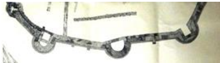
Рис.16 Фортеця Сучава, призматичні бастіони, XV ст., Археологічні дослідження К. Ромсторфера, поч. XX ст.

Північно-Західний та Південно-Західний кути західної куртини Верхньої фортеці були укріплені бастіонами, форма яких вказана по-різному: круглі ронделі в \frac{3}{4} кола, і бастіони у вигляді списів. Між кутовими спорудами вздовж внутрішнього краю рову були влаштовані квадратні бастіони для розміщення артилерійських знарядь, параметри та форма яких аналогічна бастіонам фортеці Сучава, археологічно датовані часами Стефана Великого (Romstorfer, 1913), потім у останнє десятиліття його князювання, вони були замкнуті у масивні ронделі. (Рис. 16)