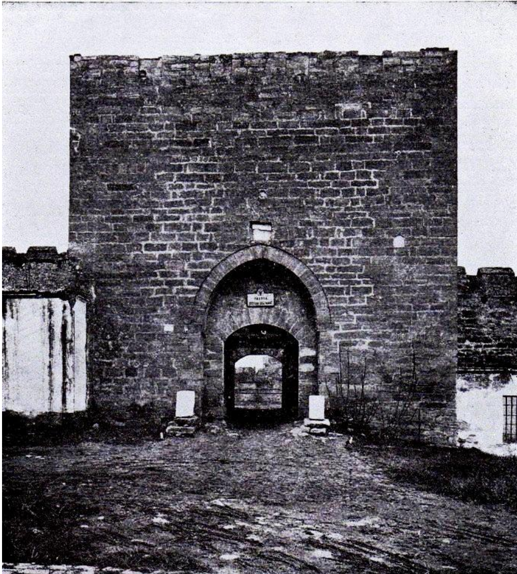
Рис.7. Поступове зниження рівня навколишньої території від входу до вежі вздовж стіни замку. Фото М. Маркс, 1918.

На фотографії зсередини вежі з видом у бік вхідного отвору видно еродовані центральні ділянки порога, але зі збереженням кам'яних бічних підвалин входу (Рис. 8).