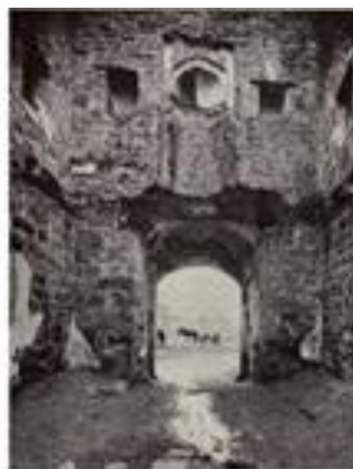
Рис.8. Внутрішній вид вхідної вежі, вид на поріг входу та на міхраб мечеті на другому ярусі, фото 1930-ті роки.

На фотографії зсередини вежі з видом у бік вхідного отвору видно еродовані центральні ділянки порога, але зі збереженням кам'яних бічних підвалин входу (Рис. 8).