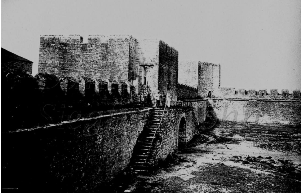
Рис.9. Вхідна вежа. Вид з боку двору, видно співвідношення порога та двору.

За цим зображенням можна розрахувати рівень порога, який на момент фотографування припадає на 20-30 см ще вище за рівень проходу. У середині вежі пороги – у бік двору і поза замком – перебувають у одному рівні, прохід у пасажі горизонтальний, але рівень землі у дворі вище рівня порога (9), що можна пояснити лише підняттям рівня землі у дворі, після зведення споруди з більшою монолітністю проти руйнівної сили артилерії.