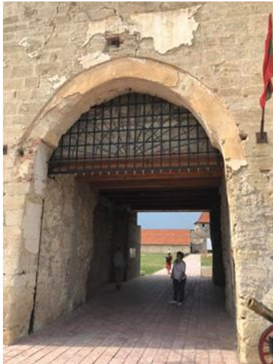
Рис. 2. Вхідний отвір вежі з розібраним склепінням та зниженою підлогою для мечеті, 2019