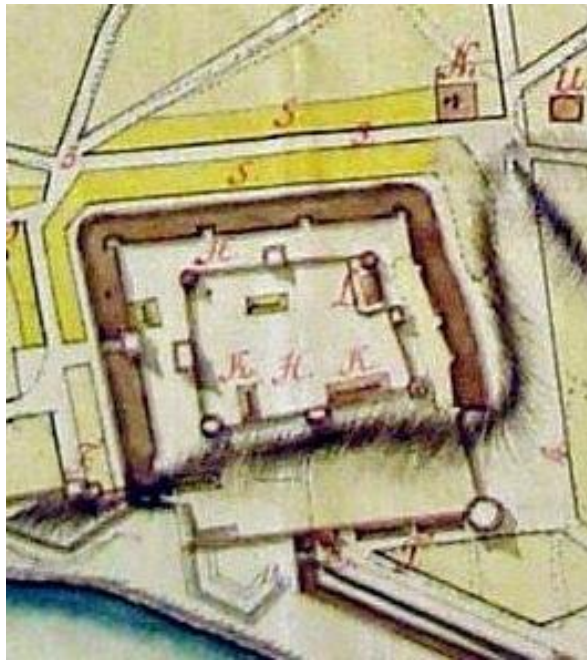
Рис.15 Замок Тігіна з Верхньою та Нижньою фортецями, розділені перепадом рельєфу, з бастіонами для артилерії, 1770-1775