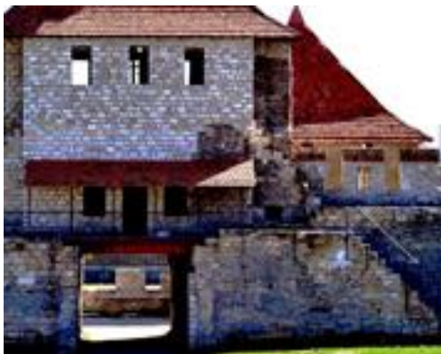
Рис.4. Вигляд «відновленої» вежі входу з боку двору, 2022 р.

Другий рівень вхідної вежі був укріплений додатковою кладкою «прикладками» у зв'язку з розташуванням всередині неї мечеті, яка, ймовірно, була перекрита склепінням, для чого необхідно було посилити стіни (Рис. 4).