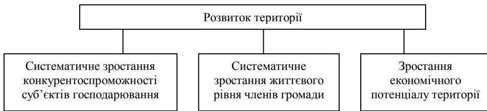
Рис. 2. Результуючі показники розвитку території

Оскільки метою Концепції реформування місцевого самоврядування та територіальної організації влади в Україні є “визначення напрямів, механізмів і строків формування ефективного місцевого самоврядування та територіальної організації влади для створення і підтримки повноцінного життєвого середовища для громадян, надання високоякісних та доступних публічних послуг, становлення інститутів прямого народовладдя, задоволення інтересів громадян в усіх сферах життєдіяльності на відповідній території, узгодження інтересів держави та територіальних громад” [7], то першочерговим завданням громади та органів її самоврядування стає забезпечення соціально-економічного розвитку території, що характеризується поступом конкурентоспроможності господарюючих суб'єктів, економічного потенціалу та життєвого рівня громадян (рис. 1).