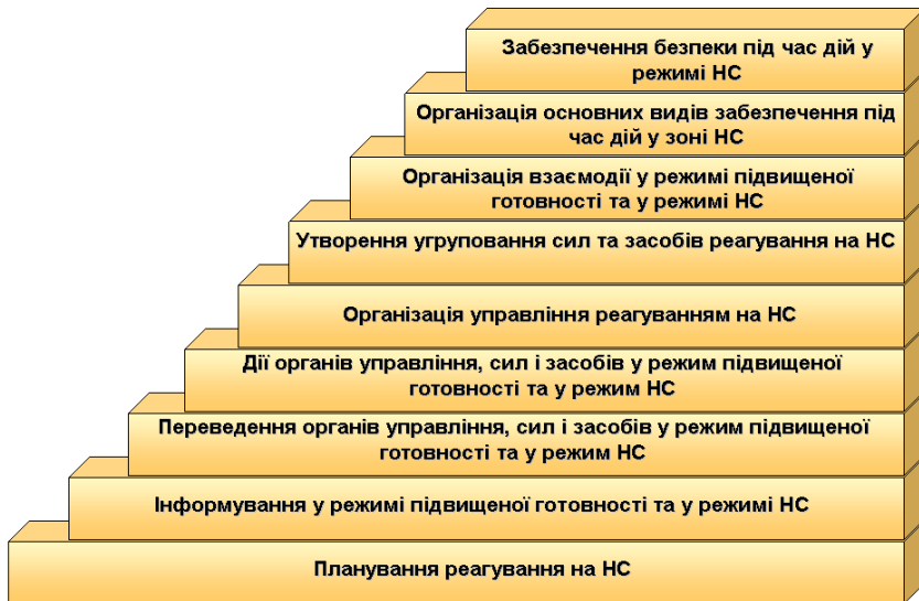
Рис. 3. Алгоритм оперативного реагування на НС

Організація оперативного реагування (рис. 3) на НС полягає у поетапному здійсненні організаційних і управлінських заходів від планування реагування на НС, інформування, переведення органів управління і сил у вищій ступені готовності, безпосереднього управління ними, організації взаємодії і всебічного забезпечення до забезпечення безпеки людей у зоні НС.