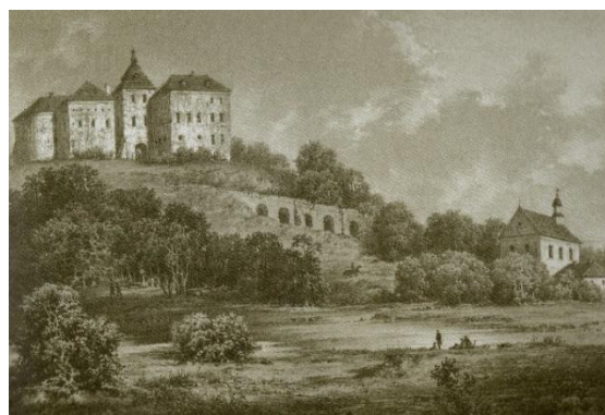
Рис. 2. Олесько над витоками річки Стир, 1870-ті р. Літографія: Наполеон Орда. (Наполеон Орда і Україна, 2014, с. 107)

На прикладі замку у Підгірцях можемо спостерігати, що споруда залишається в основному без змін, проте міняється зовнішня атрибутика – середовище, в якому існує пам'ятка, відповідно міняється і сприйняття об'єкта. Рельєфний «п'єдестал», на якому розташовувався замок, сьогодні покритий деревами, які перешкоджають прогляданню споруди на відстані з північної сторони. Про даний аспект можна говорити щодо багатьох замків, оскільки гори та погорби, на яких вони розташовуються,