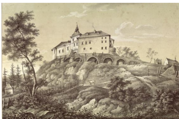
Рис. 1. Олеський замок, 1820-ті р. Літографія: Антон Лянге. (Lange, 1823)

Завдяки їм можна відчуту ту велич і могутність оборонних об'єктів, що сьогодні часто залишаються поза увагою. Знаючи як було, і що маємо сьогодні, можемо робити певні висновки. Наприклад, замок в Олеську. Вид на замок з півночі, який потрапив на полотна А. Лянге (Рис. 1) та Н. Орди (Рис. 2) сьогодні є зовсім іншим ніж у XIX столітті. Враховуючи той факт, що замок піддався цілісній стилістичній реставрації, було б доцільно відновити і шість арок кам'яного мосту, які можемо спостерігати у вищезгаданих художніх творах. Відтак образ замку сьогодні є іншим і порівняно незавершеним.