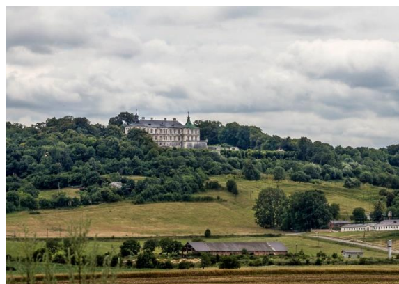
Рис. 4. Підгорецький замок, 2015.

Але питання постає наступне, наскільки достовірно є передано зображення архітектурних об'єктів, щоб слугувати базою для реставраційного втручання в споруди. Художники не передають чіткі розміри об'єкта, але передають його деталі та пропорції. Замок у Кам'янці-Подільському у кінці XIX століття мав втрачені завершення декількох веж (Рис. 5), проте сьогодні вони вже є відтворені (Рис. 6) після ряду досліджень виконаних в основному Є. Пламеницькою (Пламеницька, 1975). Замок повернув минулу велич, а от ріка Смотрич обміліла. «Творчий доробок митця було використано під час складання проектів реставраційних робіт таких визначних архітектурних пам'яток, як (...) фортеця в Кам'янці-Подільському, замки у Луцьку, Дубні та Острозі» (Березіна, 2007, с.13).