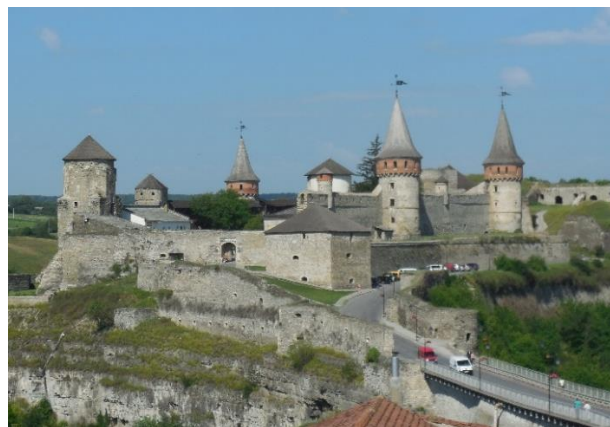
Рис. 6. Замок у Кам'янці-Подільському, 2016.

Ахроматичні зображення передають сприйняття тональної насиченості об'єкта та середовища, хроматичні – акварелі, олії – вказують на колірну гаму. Важливо, що художники передавали емоції, які в них викликало середовище, об'єкти, природа. Кожен художник обирав свій ракурс та пору дня, для милування побаченим, яким хотів поділитися з іншими через авторські твори.