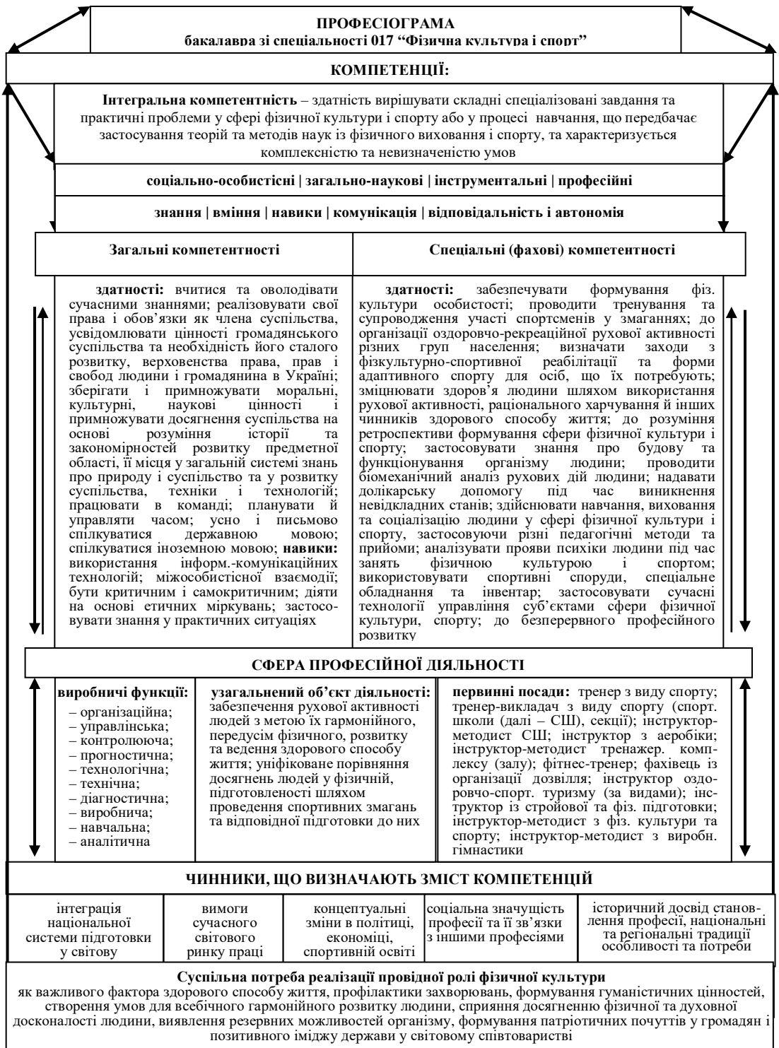
Рис. 2. Професіограма бакалавра з фізичної культури і спорту