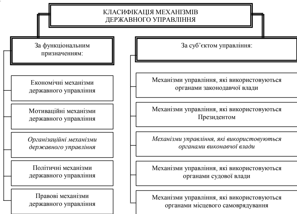
Рис. 2. Класифікація механізмів державного управління

Узагальнена класифікація механізмів державного управління подана на рис. 2. Вона включає поділ механізмів державного управління за функціональним призначенням та за суб'єктом управління.