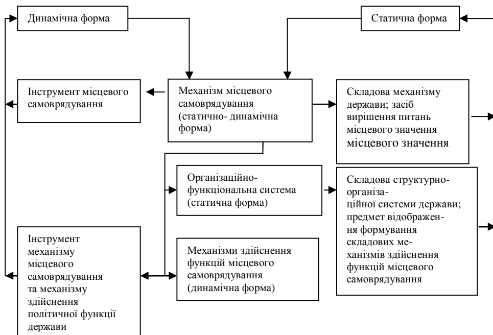
Рис. 3. Статично-динамічна форма механізму місцевого самоврядування та її призначення

Статична форма механізму місцевого самоврядування складається із системи місцевого самоврядування, головних функцій, засобів їх здійснення; за призначенням вона є складовою структурно-організаційної системи держави, предметом відображення формування складових механізмів здійснення функцій місцевого самоврядування. Динамічна форма є сукупністю складових механізмів здійснення функцій місцевого самоврядування, що за призначенням є інструментом механізму місцевого самоврядування та механізму здійснення політичної функції держави.