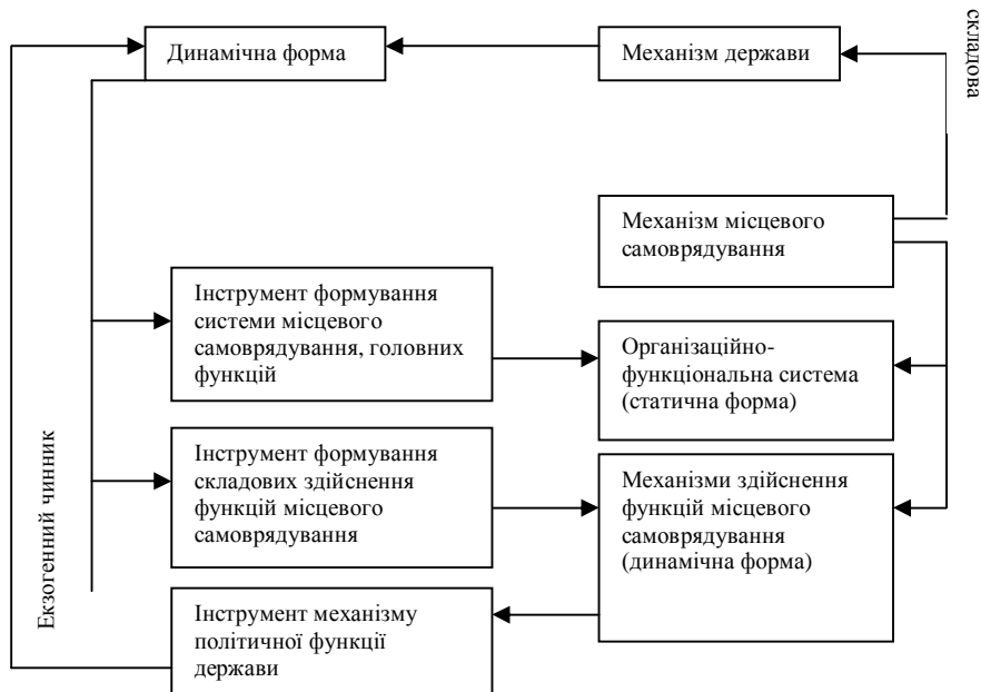
Рис. 2. Взаємозв'язок механізму місцевого самоврядування із механізмом держави (динамічною формою)

У такому взаємозв'язку механізм держави виконує роль екзогенного чинника у формуванні механізму місцевого самоврядування (рис. 2).