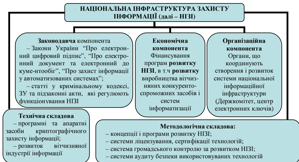
Рис. 3. Структура компонентів національної інфраструктури захисту інформації