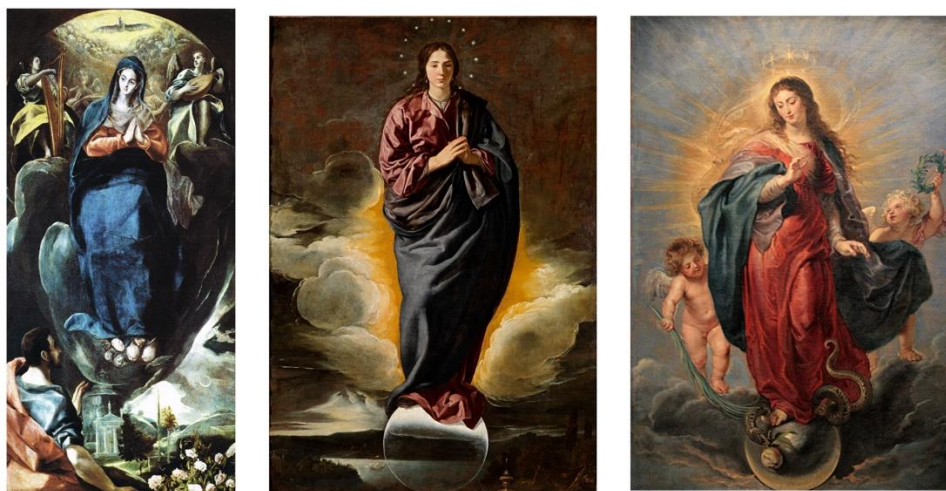
Рис. 4. Зображення Богородиці Непорочного Зачаття На полотнах. Ель Греко, Дієго Веласкес, Пітер Пауль Рубенс

Образ Непорочного Зачаття Діви Марії популярним став у часи бароко, де зображали його на полотнах Ель Греко, Дієго Веласкес, Пітера Пауль Рубенс та інші. (Рис. 4)