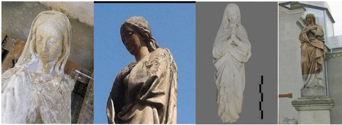
Рис. 5. Порівняльний аналіз скульптури Богородиці Непорочного Зачаття із села Добряни та села Демні

Порівнюючи деякі із скульптур відомих авторів епохи пізнього бароко та класицизму, можна виділити принципові подібності: портретні риси, виконання слізників, характер зображення губ, ніг та рук.