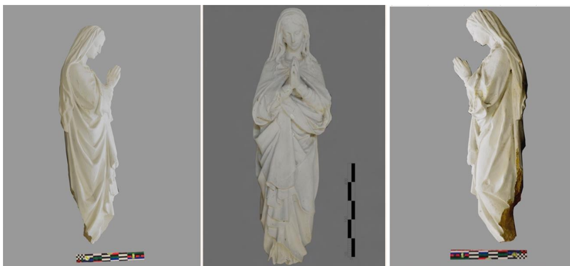
Рис. 3. Фрагмент скульптури Богородиці Непорочного Зачаття Із села Добряни, перед початком дослідження.

Скульптура Непорочного Зачаття Діви Марії виконана у класичному стилі. Образ Богородиці потрактований професійно та канонічно. (Рис. 3)