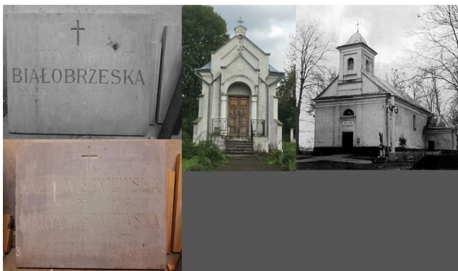
Рис. 1,2. Пам'ятні таблиці , знайдені при каплиці у Селі Добряни. Каплиця Із Села Добряни. Відбудована церква 1830-1839.