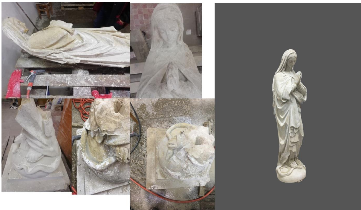
Рис. 7, 8. Поетапне очищення скульптури, Скульптура після реставрації.

Після завершення етапу склейки скульптури, було виконано доповнення втрачених елементів. Було використано мінеральний карбонатний розчин. Після двотижневої технологічної перерви приступили до етапу тонування доповнених частин з метою досягнення органічної однорідності фігури. Наступним етапом є покриття каменю біоцидним розчином довготривалої дії. При завершенні реставрації твір потрібно покрити вапняною водою для вирівнювання загального тону скульптури. (Рис. 7, 8).