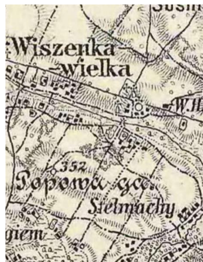
Імперія Габсбургів 1869 – 1887 рр.