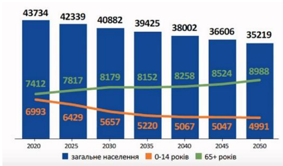
Рис. 1. Прогноз чисельності України за даними 2019 року, тис. осіб

На кількість трудових ресурсів в країні впливає величезна кількість чинників, зокрема, кількість працездатного населення, показники народжуваності та смертності, темпи старіння населення, ВВП на душу населення, рівні бідності та безробіття, рівень заробітку тощо.