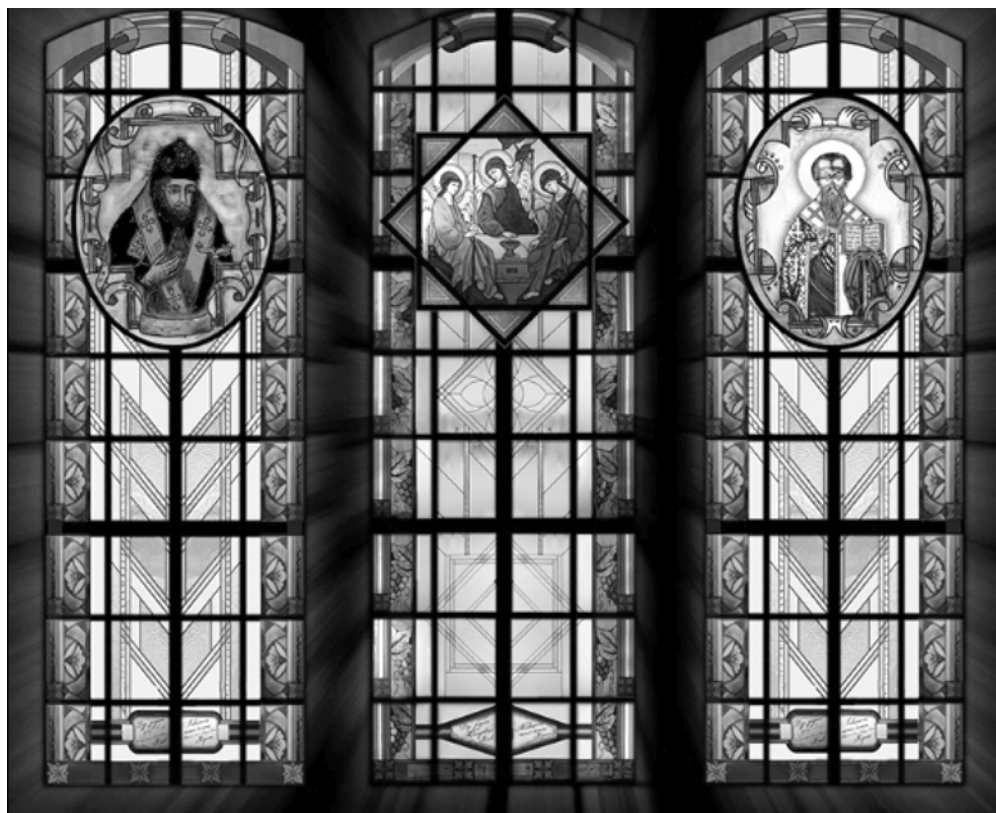
Рис. 7. Сучасні вітражні вікна, виконані у стилі Тіффані