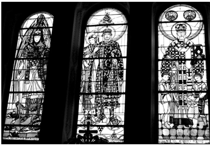
Рис. 4. П. Холодний. Вітражі церкви у с. Мражниця (тепер у складі м. Борислав) Львівської обл., 1930-ті рр. та церкви в с. Озеряни Борцівського р-ну Тернопільської обл., 1936–1937 рр.