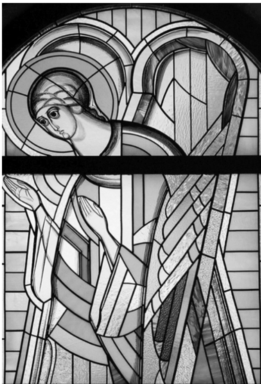
Рис. 5. І. Медвідь. Ангел. Церква в Отаві. Виконали в матеріалі Ігор та Орест Гарнавські. 1999–2000 рр.