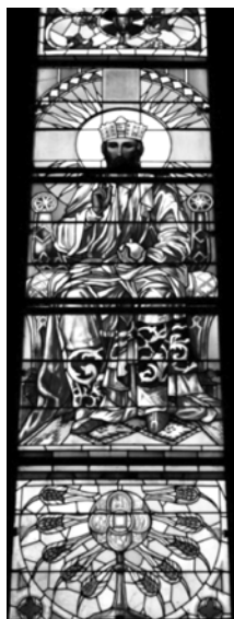
Рис. 3. Д. Горняткевич. Ісус Христос Вседержитель