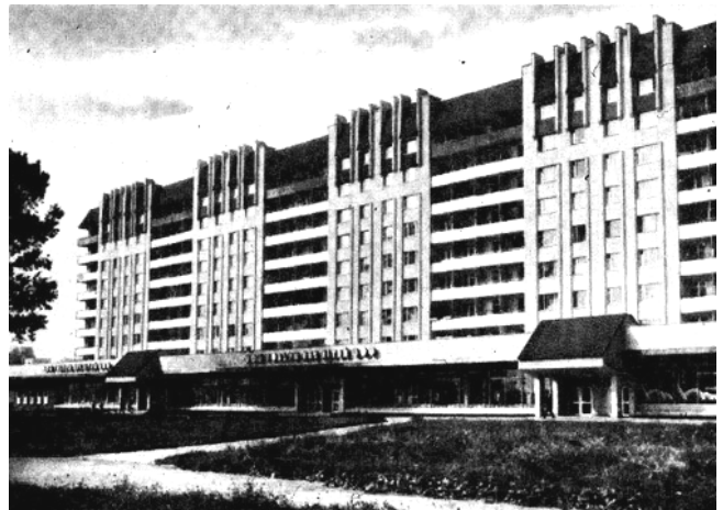
Рис. 3. Північний житловий район вул. 700-річчя Львова

При розробці проєкту детального планування вул. Стрийської обрано вже новітні європейські підходи до композиційного вирішення силуету в'їздної магістралі Львова. Теж ж саме було і з ПДП вул. В. Чорновола. Висотний ряд будинків із вбудовано-прибудованими об'єктами інфраструктури вдало сформували обличчя цього району сучасного Львова. Усе формувалося на основі діючого та високо відзначеного державною нагородою генерального плану міста, який знаходився у кабінетах головних архітекторів області й міста та який ніхто не мав права порушувати. У зверненнях громадян, установ і організацій завжди давалися ствердні відповіді на тему достовірної реалізації