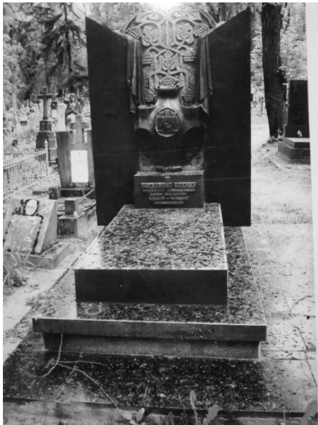
Рис. 4. Надмогильний пам'ятник першому мерові демократичного Львова Богдану Котику на Личаківському цвинтарі. В основі пам'ятника закладено герб Львова авторства Ярослава Новаківського. Автори проєкту: архітектор О. Ярема, скульптор Я. Скакун.