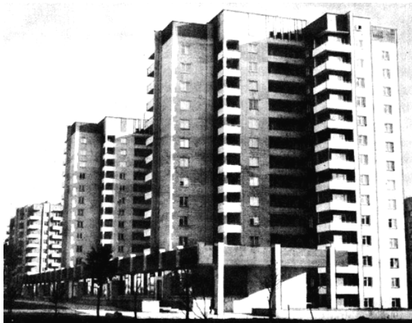
Рис. 2. Південний житловий район Львова

А в основі планувальних містобудівних рішень мікрорайонів насамперед ставилися такі завдання: формування житлових зон, громадських центрів, єдиної схеми організації транспортного і пішохідного рухів та інженерної інфраструктури, зокрема, автономної.