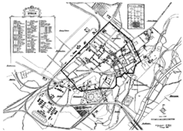
Рис. 6. Карта Стрия, укладена М. Січковським та В. Віктором, 1922 р., де штрихпунктирною лінією показано межі історичного архітектурного ареалу, з відмітками сучасної інвазії в ньому (I – будинок Геіселькорна; II – будинок Борака) та суцільною, зеленою – пропонуваній архітектурно-містобудівний туристичний маршрут