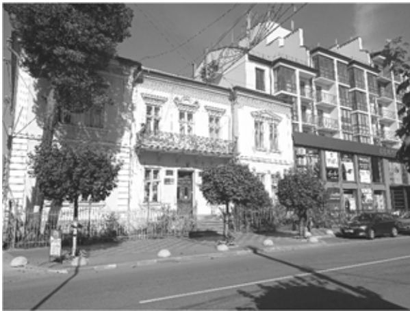
Рис. 5. Приклад просторової інвазії в історичному архітектурному середовищі. Фото Д. Гринькевича, 2022 р.

наприклад, є збережені тримачі для вазонів, як рядових, так і окремих горщиків. На балконну частину виходить композиція з двох дерев'яних вікон (повністю збережених у всій будівлі) та дверей, над якими – сандрики з фризною та карнизною частинами. Фризи над вікнами другого рівня оточені кронштейнами. Також над карнизною частиною дверей збереглися декоративні вази-амфори. Вікна в ризалітах є об'єднані в пари та декоровані на другому поверсі трикутним сандриком. Добре збережений головний вхід із дерев'яними дверима, які відображають у своєму композиційному вирішенні декоровані елементи імпосту, профілів, тафель та притворної планки, та сходовою частиною із кованими перилами. Варто відзначити, що є ряд проблем із замоканням фасаду, пошкодженою карнизною частиною та з архітектурними елементами на боковому фасаді. Вищезазначений аналіз підтверджує, що будівля є дуже важливим елементом ансамблю центральної вулиці. І тут не можна не дослідити та не показати просторової інвазії, яка відбулася на сусідніх ділянках, адже на сьогодні пам'ятка оббудована висотною забудовою, яка не відповідає оточенню (див. рис. 5). Таке втручання в історичну забудову погано впливає на пам'ятки та на їх сприйняття. Важливо запобігти таким безвідповідальним інвазіям сучасних споруд в історичну забудову Стрия.