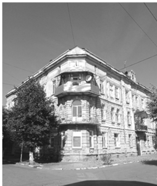
Рис. 4. Зображення сучасного стану будинку Мойше Геіселькорна, 2022 р.