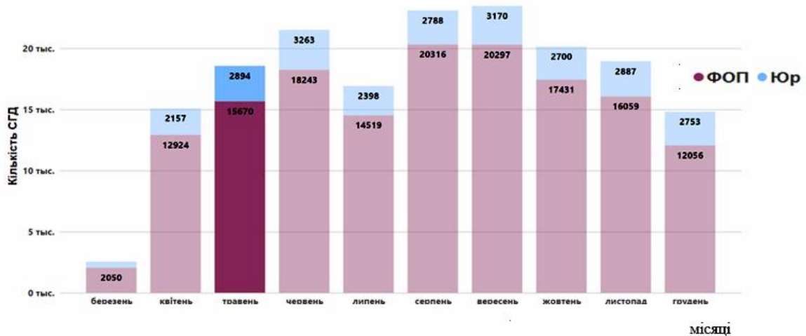
Рис. 2. Динаміка реєстрації нових суб'єктів господарювання від початку повномасштабної війни, 2022 р. [6]

Загалом, резилентність вітчизняного бізнесу в умовах шоку повномасштабної війни була різною: кінець лютого – березень (початок війни) – бізнес зазнав шоку критичного рівня, його резилентність та опірність до загрози були вкрай низькими. У цей період у країні реєстрація нового бізнесу не здійснювалася (рис. 2), що було спричинено, з одного боку, закриттям публічних реєстрів, а з іншого – панікою та часовою і просторовою невизначеністю воєнних дій.