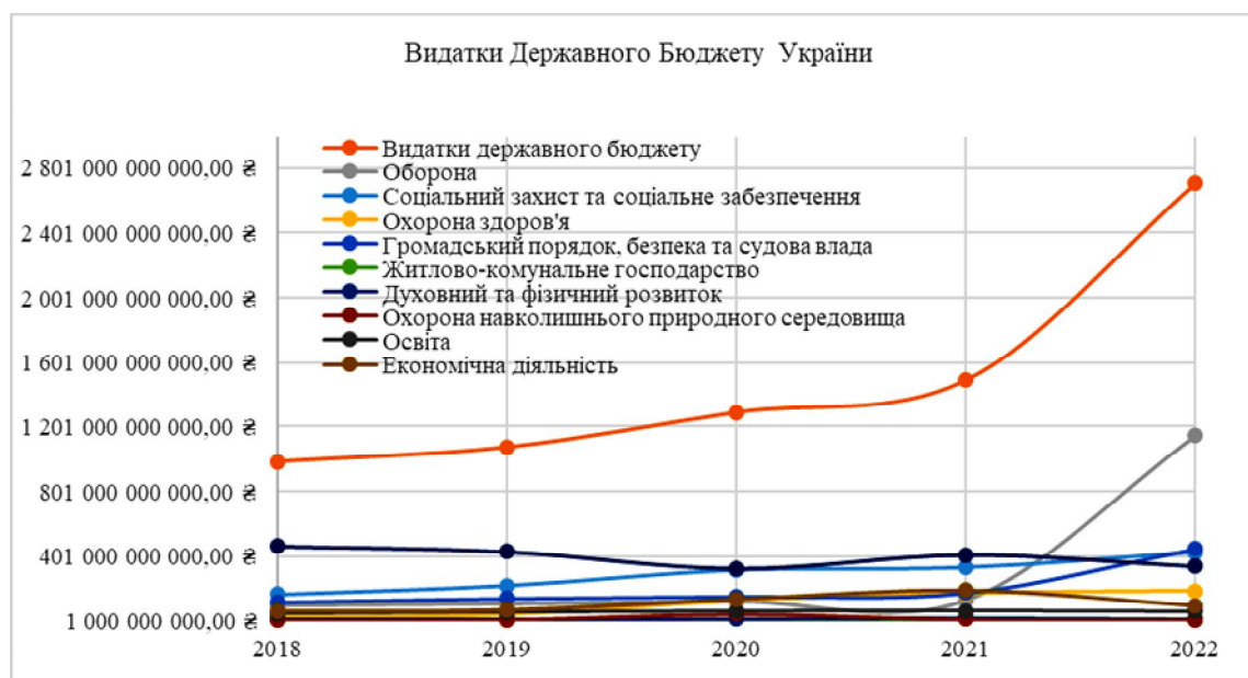
Рис. 1. Видатки державного бюджету України за 2018–2022 рр. *