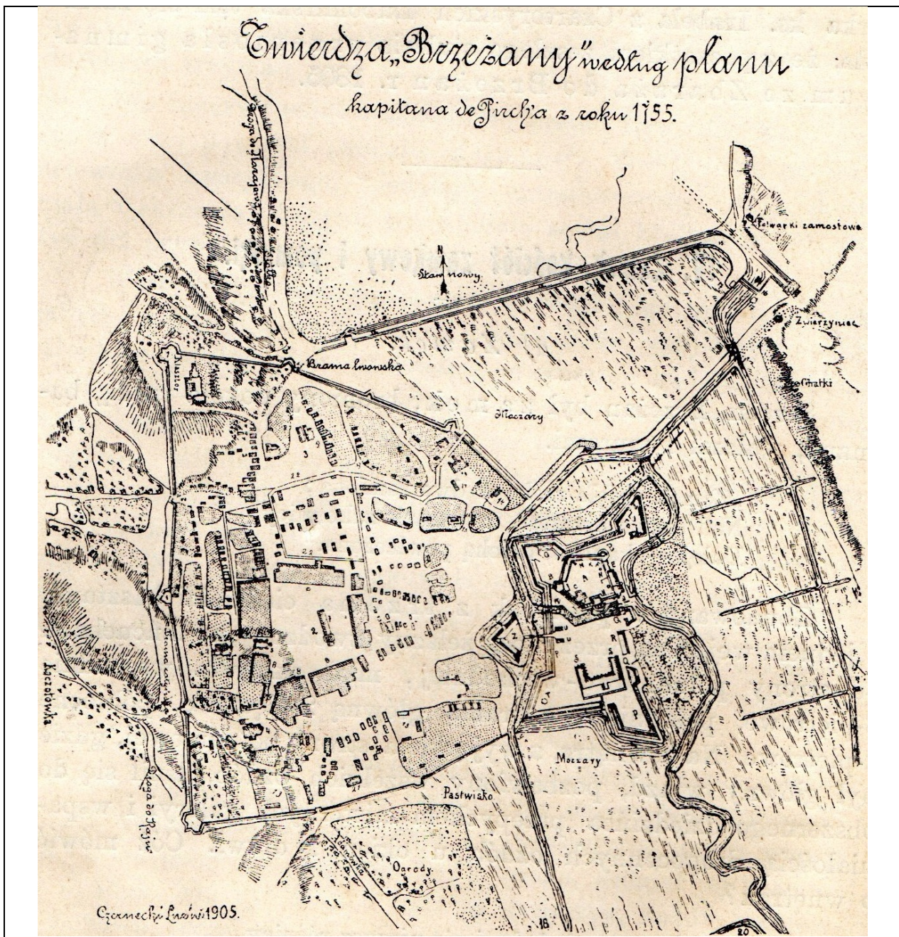
Рис. 1. План міста капітана де Пірха 1755 р., із нанесеними фортифікаційними спорудами. Копія 1905 року В. Каліновського (Maciszewski, 1911, s. 25).

Оборонний пояс міста Бережани у середині XVIII ст. значно розширився і за годинниковою стрілкою тягнувся від фортеці на захід попри тодішні болота в межах вулиці – Вальної, повертаючи на вулицю з сучасних назвою Мирослава Кушніра, і опускався вниз до теперішньої вулиці Олени Кульчицької. Саме ці вулиці й утворились на початку XIX століття за межами міста вздовж засипаних оборонних ровів, що перетворились на дороги. Далі вали проходячи через Райський Потік тягнулися до початку вулиці Зеленої (тепер вул. Старухів), і схилом гори Святого Миколая піднімалися до території монастиря оо. Бернардинів. На горі різко повертаючи на схід оборонний пояс опускався до Львівської брами та вул. Львівську (тепер вул. В'ячеслава Чорновола) й тягнувся попри вулицю з сучасною назвою Бояна та примикав до замкових фортифікаційних споруд (Див. Рис. 1).