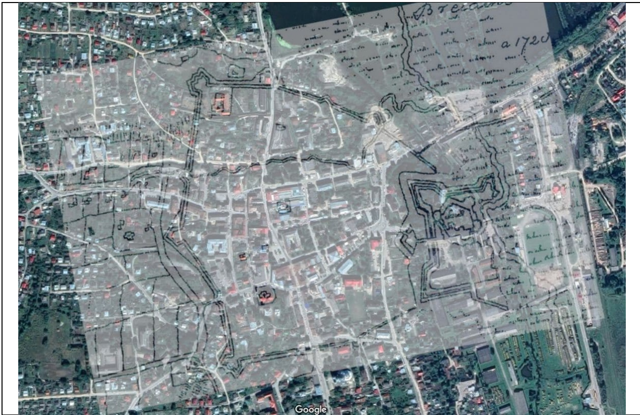
Рис. 2. Визначення місцезнаходження втрачених оборонних валів та ровів при накладанні мапи 1720 р. на сучасну мапу в 2020 р. (Ostrowski, red., 2007, s. 525).

території монастиря до колишньої Львівської брами (тепер вул. В. Чорновола, 23), та залишки оборонного валу міста на вул. Бояна за будинками № № 14, 16.