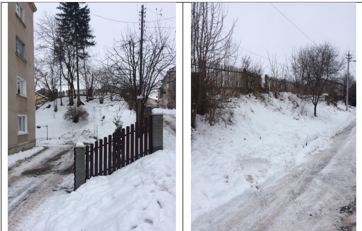
Залишки оборонного валу в перерізі поруч будинку на вул. Братів Лепких, 5А та залишки валу на вул. М. Кушніра. Фото автора, грудень 2023 р.

Після ліквідації австрійською владою оборонних валів міста у 1809 р. та 1812 р. все ж збереглися кілька ділянок з фрагментами валів та оборонних ровів. Починаючи від території, що майже примикає до вул. Шевченка і розміщена за будинками на вул. М. Кушніра, 2 та 4, сліди валу і проходять понад вул. Валова попри прилеглі території будинків за № № 16, 18, 20, 22, 24 (особливо примітний вал за віллою професора гімназії о. Василя Дубицького). Зі сторони вул. М. Кушніра, вал проходить біля будинків № № 7, 8, 9 та 11. Проглядається вал і за будинками на вул. М. Кушніра, 14, 16 та під будинками № 20 та № 20 А. Бастіон південно-західного прясла доходив приблизно до місць, де розміщені теперішні будинки на вул. Кармелюка, 3, 4, 6 і мав корончату форму у вигляді тризуба, до речі, як і його ідентичний північно-східний бастіон.