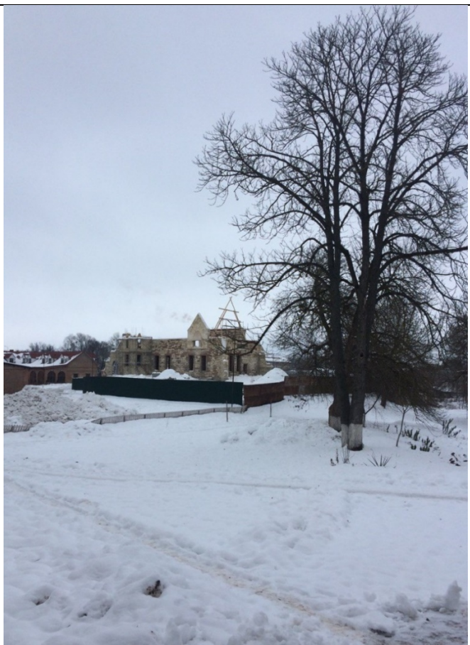
Рис.4. Залишки бастиону, на якому будується дитяче кафе. грудень 2023 р.

В наш час у майже всіх малих містах-заповідниках України найбільш гострою проблемою із наболілого питання охорони пам'яток архітектури та історії є здійснення контролю держави за їх збереженням, брак коштів на їх утримання, консервацію, реставрацію та відновлення.