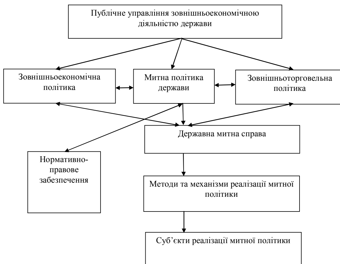
Рис. 1. Митна політика в системі публічного управління зовнішньоекономічною діяльністю держави.

Загалом митну політику варто розглядати у вузькому та широкому сенсі. У першому випадку вона характеризується суб'єктами її реалізації, а в другому – національними економічними інтересами. Ці підходи до розуміння сутності зазначеної категорії є рівнозначними. Митна політика тісно пов'язана із зовнішньоекономічною та зовнішньоторговельною політиками держави, тому її варто розцінювати як засіб налагодження тісної взаємодії держави із зарубіжними партнерами.