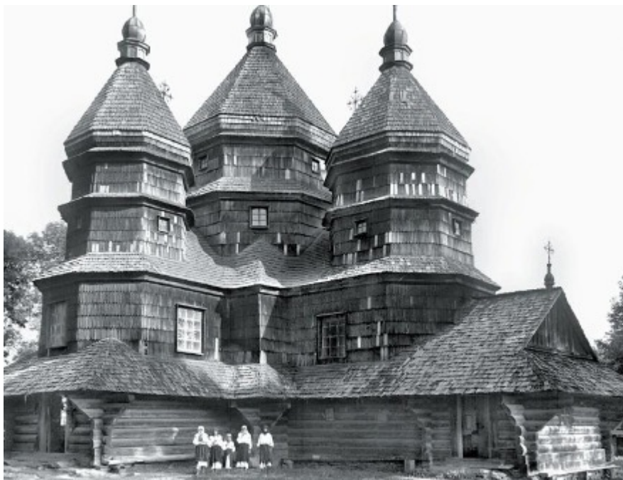
Рис.5. Гуцульська школа народного храмового будівництва. Церква Успення Прсв. Богородиці, с. Княждвір Івано-Франківської обл., 1864 р. НТШ інв. № 1800.

Необхідно зазначити, що В. Щербаківському ми завдячуємо фіксацію хрестів, капличок на Гуцульщині, Бойківщині. У с. Тюдів він сфотографував “Хрест на цвинтарі зі старої церкви” (НТШ інв. № 3925, МЕХП 2230), “Хрести на цвинтарі” (НТШ інв. № 3925 3671, 3673–3875, 3917, МЕХП 2231–2235), “Капличка в Тюдові” (НТШ інв. № 3872); в с. Микуличин “Хрест побіч церкви” (НТШ інв. № 3875, МЕХП 2231); в с. Черче Рогатинського повіту “Кам’яний хрест біля старої церкви (на цвинтарі)” (НТШ інв. № 3700, МЕХП 1978), “Кам’яний хрест на цвинтарі” (НТШ інв. № 3694, МЕХП 2286); в м. Сколе “Різьблений хрест” (НТШ без номера, МЕХП 2185); в с. Жовчів Рогатинського повіту “Кам’яний хрест на цвинтарі” (НТШ інв. № 3702, МЕХП 1975), “Різаний дерев’яний хрест” (НТШ інв. № 3709 МЕХП 1974). (Рис. 5, 6).