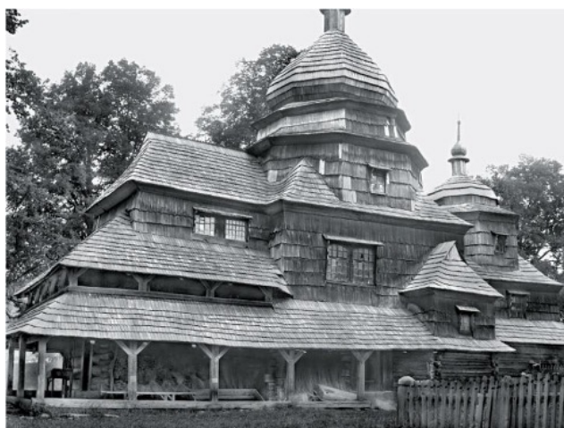
Рис.3. Бойківська школа народного храмового будівництва. Церква Успіння Прсв. Богородиці, с. Топільниця Горішня (нині с. Топільниця Львівської обл.), 1730 р. НТШ інв. № 1724.

Сьогодні також наявні негативи дзвіниць церков у селах: Різдвяни, Гошів, Витвиця (Долинського повіту), Підгороддя, Чесники (Рогатинського повіту), Верхня Бережниця Шляхетська, Станькова, Збора (Калуського повіту), Яйківці (Жидачівського повіту), Топільниця Горішня, Топільниця Долішня (Турківського повіту), Яремче (Надвірнянського повіту). Зафіксував візуально В. Щербаківський в околицях Львова в селах Вовків, Жирівка, Кугаїв церковні речі (рис. 3, 4).