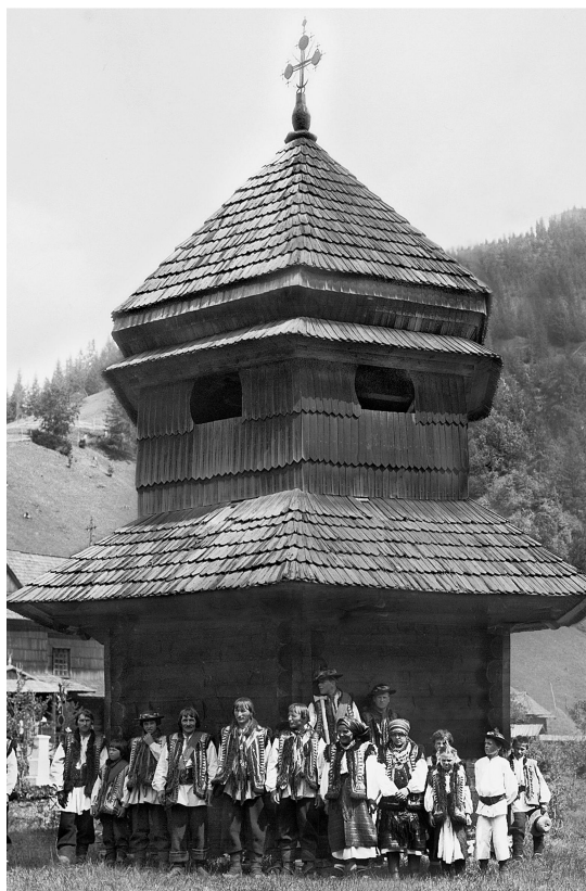
Рис.7. Дзвіниця, с. Бистрець Івано-Франківської обл., 1872 р.