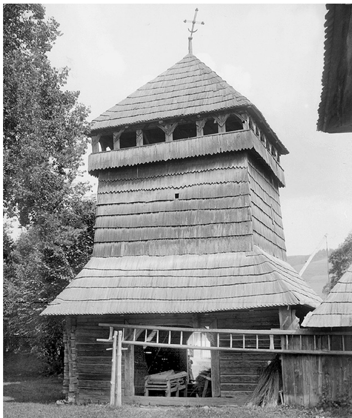
Рис.8. Вежа-дзвіниця з "підсябиттям". Топільниця. Світлина В. Щербаківського. Архів ІН НАНУ. НТШ інв. № 1685.