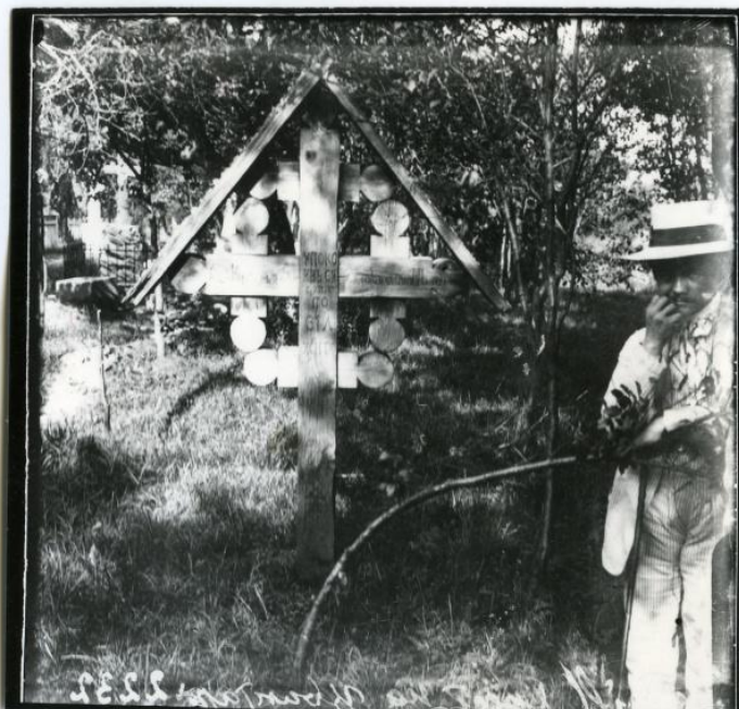
Рис.9. Хрести на цвинтарі в Тюдові. Світлина В. Щербаківського. Архів ІН НАНУ. НТШ інв. № 2232.

Необхідно вказати, що ще за життя В. Щербаківського його фотографії використовувались у різних виданнях без посилання на нього. Він пише про це так: "Замічу до речі, що в Історії Ігоря Грабаря представлено ще лемківську церкву з мого знимку, але без мого дозволу, і не вказано що се я