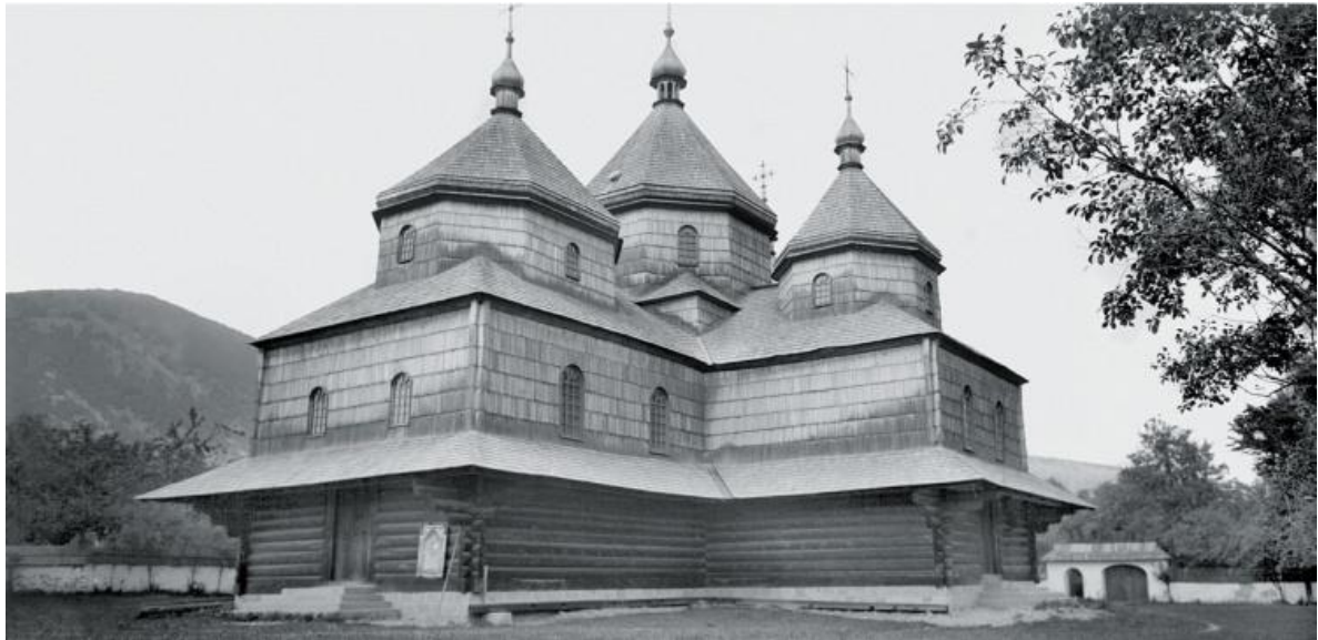
Рис. 6. Гуцульська школа народного храмового будівництва. Церква Введення Прсв. Богородиці, с. Тюдів Івано-Франківської обл. НТШ інв. № 1797.

За В. Щербаківським числиться 6 негативів хрестів з Буковини. На конвертах, в які уложені негативи, вказано “Буковина фот. В. Щербаківський?” (НТШ інв. № 27465/6, МЕХП 1702–1705, 1363).