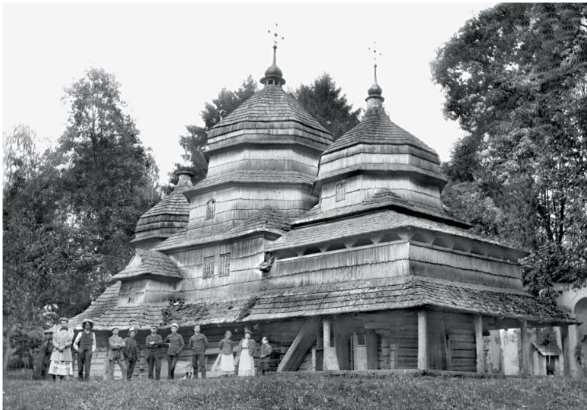
Рис. 2. Бойківська школа народного храмового будівництва. Церква св. Миколая, с. Тур'є Львівської обл., 1690 р. НТШ інв. № 1613.

Сьогодні також наявні негативи дзвіниць церков у селах: Різдвяни, Гошів, Витвиця (Долинського повіту), Підгороддя, Чесники (Рогатинського повіту), Верхня Бережниця Шляхетська, Станькова, Збора (Калуського повіту), Яйківці (Жидачівського повіту), Топільниця Горішня, Топільниця Долішня (Турківського повіту), Яремче (Надвірнянського повіту). Зафіксував візуально В. Щербаківський в околицях Львова в селах Вовків, Жирівка, Кугаїв церковні речі (рис. 3, 4).