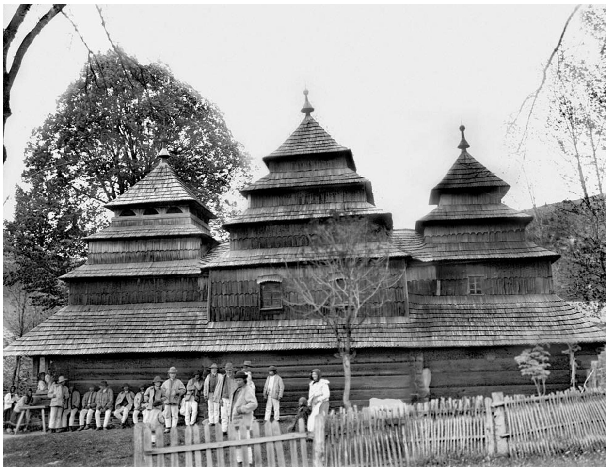
Рис. 1. Бойківська школа народного храмового будівництва. Церква Покрови Прсв. Богородиці, с. Таламаш (нині присілок с. Гукливий Закарпатської обл.), XVIII ст. Світлина В. Щербаківського. Архів ІН НАНУ. НТШ інв. № 1860.

Аналізуючи наявні негативи В. Щербаківського, необхідно відзначити, що найбільше на них зафіксовано церков та дзвіниць. Збереглися негативи дерев'яних церков з його подорожей на Бойківщину (Бориня, Волосянка, Матків, Славсько, Сколе, Топільниця Горішня, Топільниця Долішня, Тур'є, Турка), Буковину (Конятин), Закарпаття (Таламаш, Плав'я, Шелестів), Покуття (Балинці, Княздвір, Коломия, Хлібичин, Трофанівка, Тюдів), Гуцульщину (Бистрець, Довгополе); Рогатинський (Вербилівці, Данильче, Жовчів, Мартинів, Підгороддя, Рогатин), Жидачівський (Волцнів (Заріччя), Іванівці, Яйківці) повіти (рис. 1, 2).