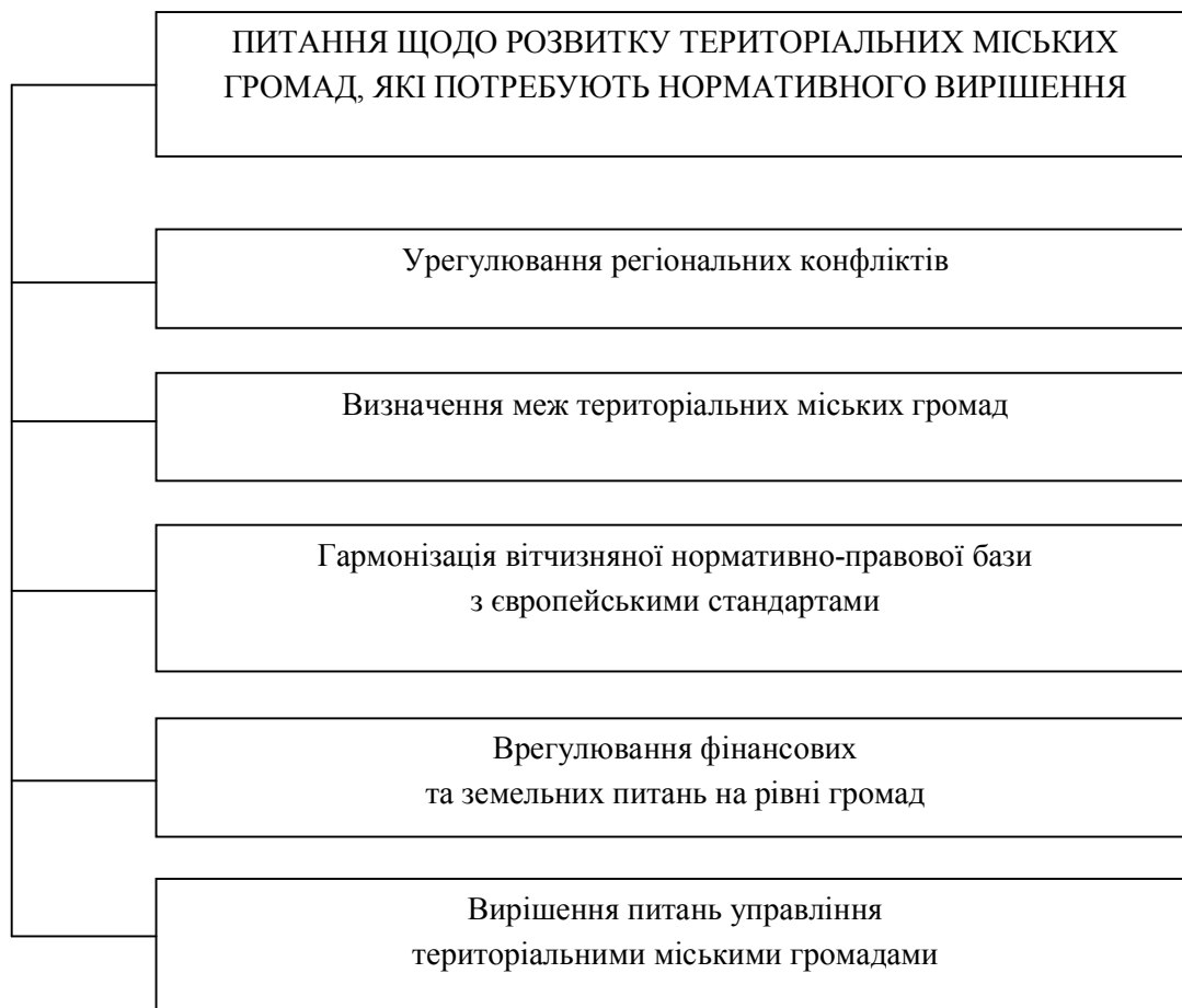
Рис. 2. Питання щодо розвитку територіальних міських громад, які потребують нормативного вирішення

торіальна цілісність та недоторканість; питання, що стосуються безпеки та захисту кордонів України; оподаткування; митна справа; державний контроль та аудит; ядерна та радіаційна безпека;