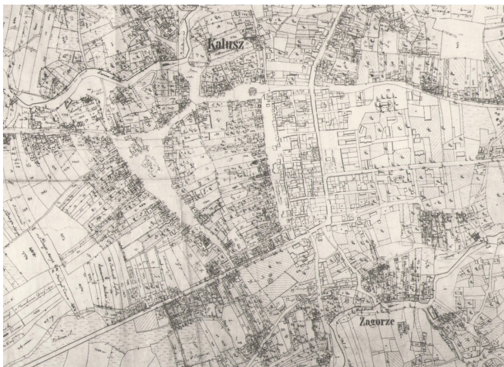
Рис. 1. Кадастрова карта м. Калуша 1850 року. Фрагмент. ЦДІА України у Львові. – Ф.186. – Опис № 1. – Справа 6576.

Також до періоду XV ст. належать відомі згадки про володіння міста соляними копальнями, які існували у цій місцевості ймовірно ще за княжих часів і раніше (Грабовецький, 1997).