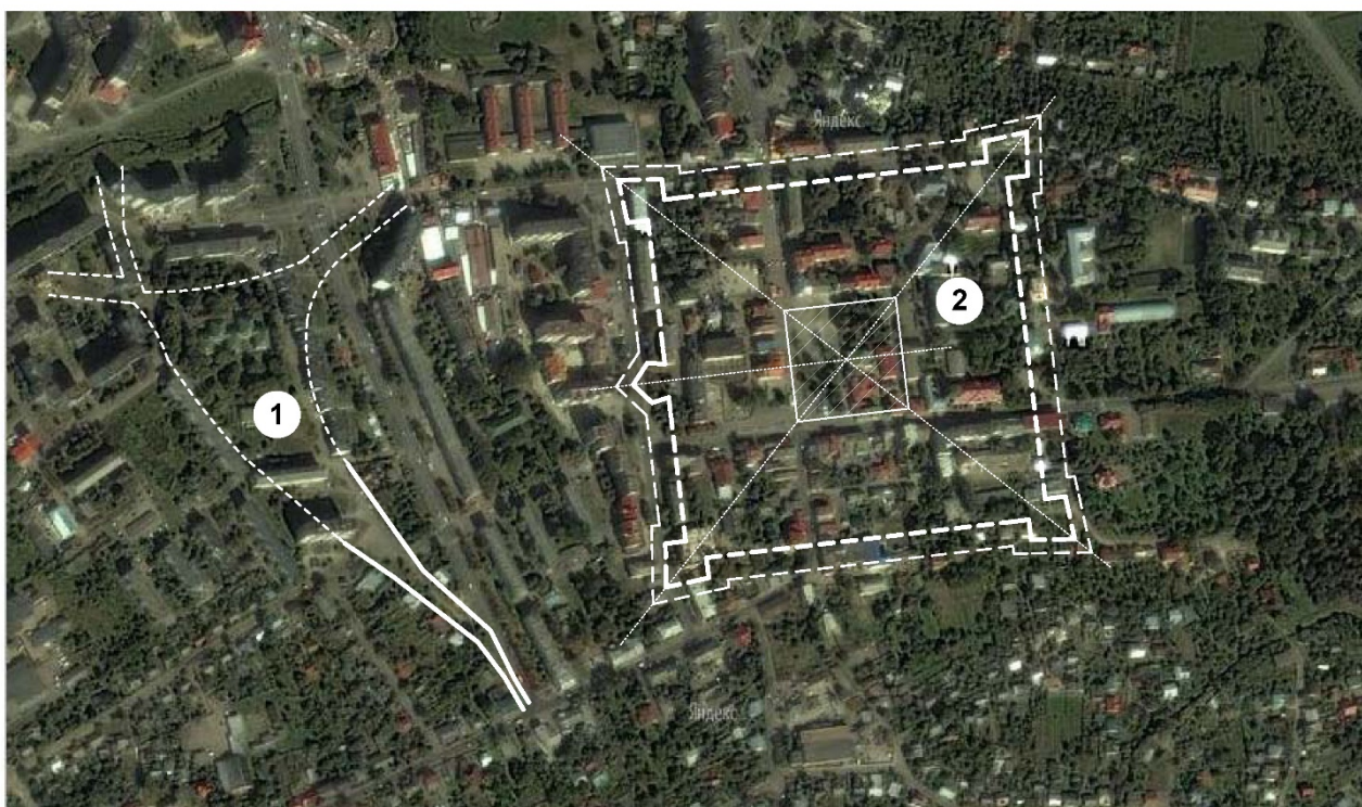
Рис. 3. Схема розташування цінних елементів історичного ядра міста Калуша нанесена на сучасну аерофотозйомку. Експлікація: 1. Межі історичної торгівлі періоду XV ст. 2. Межі фортеці XVII – XVIII ст. із середмістям.

Проаналізувавши відомі описи та зображення, співставивши історичні та сучасні картографічні матеріали нам вдалось зробити висновки щодо збережених цінних об'ємно-розпланувальних елементів історичного ядра міста та ідентифікувати розташування втрачених його складових (рис.3).