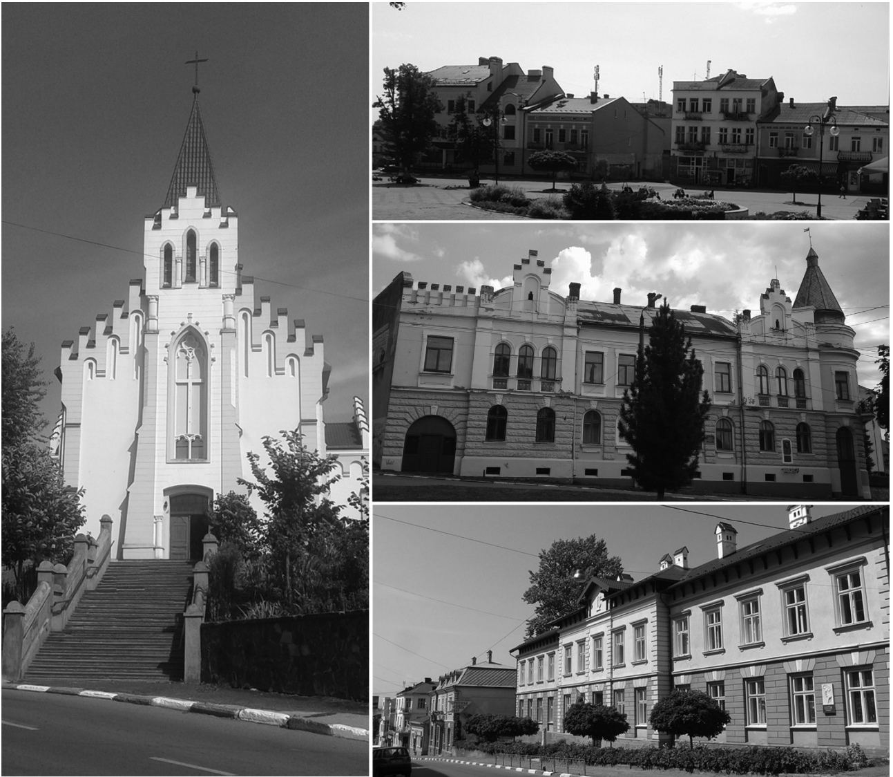
Рис. 4. Цінна забудова історичного ядра міста Калуша. Існуючий стан. Фото 2022 р.

Важливе місце у процесі ідентифікації втрачених об'єктів історичного середмістя відіграє характерне терасоване підвищення рельєфу у частині ймовірного існування колишнього італійського саду на території замку-резиденції.