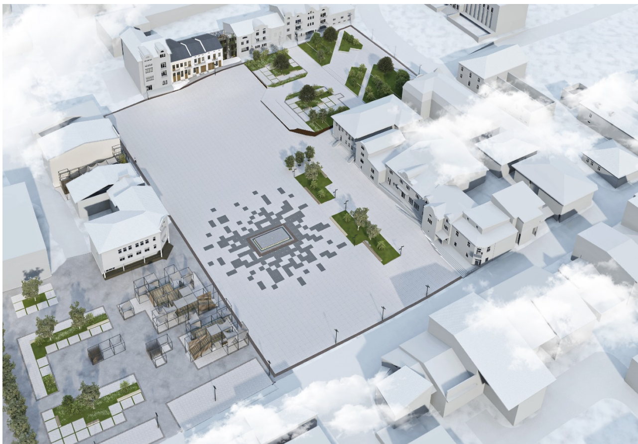
Рис. 6. Пропозиція “Символічного ознакування історичної площі ринок у місті Калуші”. 3D зображення. Автор Бербець Вікторія.

резиденції старости, так і фортифікаціям. Цікавим аспектом є те, що, очевидно, забудова середмістя та конструкція фортифікацій була дерев'яною на період XVII – XVIII ст.