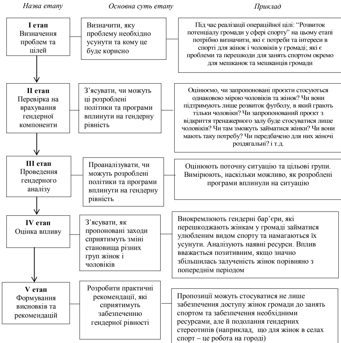
Рис. 1. Алгоритм здійснення оцінки гендерного впливу програми чи політики місцевого самоврядування

Основні етапи та їх послідовність під час оцінювання гендерного впливу програми чи політики місцевого самоврядування подано на рис. 1.