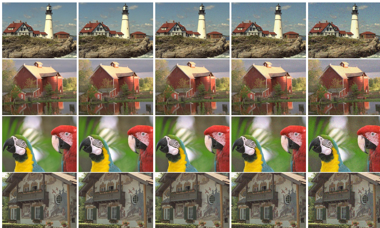
Рис. 2. Приклади зображень з групи перевірних для навчання нейронної мережі

В першому варіанті розглянуто задачу регресії, в якій явно використано числові значення усереднених експертних оцінок якості зображень. Всі зображення поділено на дві групи, в першій групі 2400 навчальних зображень з іменами файлів від i05_01_1.bmp до i20_01_5.bmp, в другій групі 600 перевірних зображень з іменами файлів від i21_01_1.bmp до i25_01_5.bmp для перевірки результатів роботи нейронної мережі на файлах, на яких вона не навчалася. На підготовчому етапі формують два файли на основі всіх відповідних зображень – файл вхідних навчальних даних розміром 2400 \times 384 \times 512 \times 3 = 1\,415\,577\,600 байтів та файл вхідних перевірних даних розміром 600 \times 384 \times 512 \times 3 = 353\,894\,400 байтів. Ці дані перетворюються з формату uint8 у формат float32, що збільшує кількість даних в чотири рази.