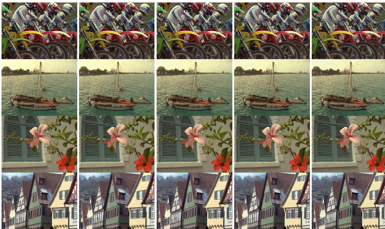
Рис. 1. Приклади зображень з групи зображень для навчання нейронної мережі

На рис. 1 наведено приклади зображень з бази TID2013, утворених з чотирьох базових зображень спотвореннями першого типу з п'ятьма рівнями, які використано для навчання нейронної мережі.