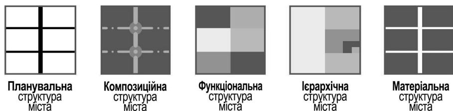
Рис. 6. Особливості структурної організації міста

Матеріальній структурі міста, що розглядається як ієрархічно впорядкована система, властиві різні види структур (рис. 5). Ця властивість полягає в тому, що матеріальна структура міста на різних рівнях її організації складається з окремих, але взаємозалежних частин, що взаємодіють і утворюють структурно-функціональну єдність на рівні: міста, його фрагмента, зумовленого планувальним каркасом, і кварталів, визначених вулично-дорожньою мережею.