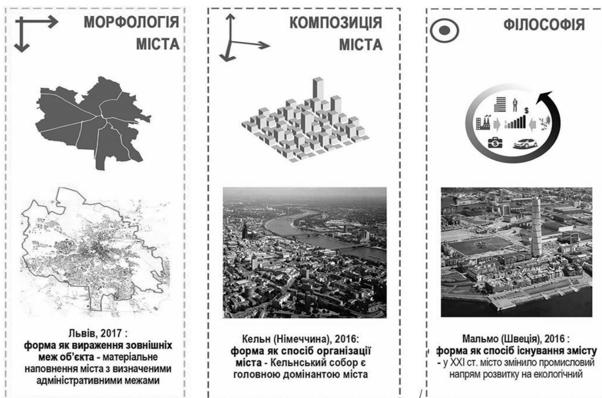
Рис. 1. Способи вияву форми міста

Для міста як об’єкта дослідження та пізнання його визначеної предметної сфери прийнято формальні властивості , пов’язані з виявом фізичної форми (рис. 1, 2 та 3) та морфологічної структури в містобудуванні. Для дослідження формальні властивості мають концептуальне значення і здатні комплексно відображати внутрішні та зовнішні характеристики об’єктивних аспектів (фізичної реальності) міста. До них віднесено обмеженість, організованість, освоєність, розвиненість, складність, сформованість.