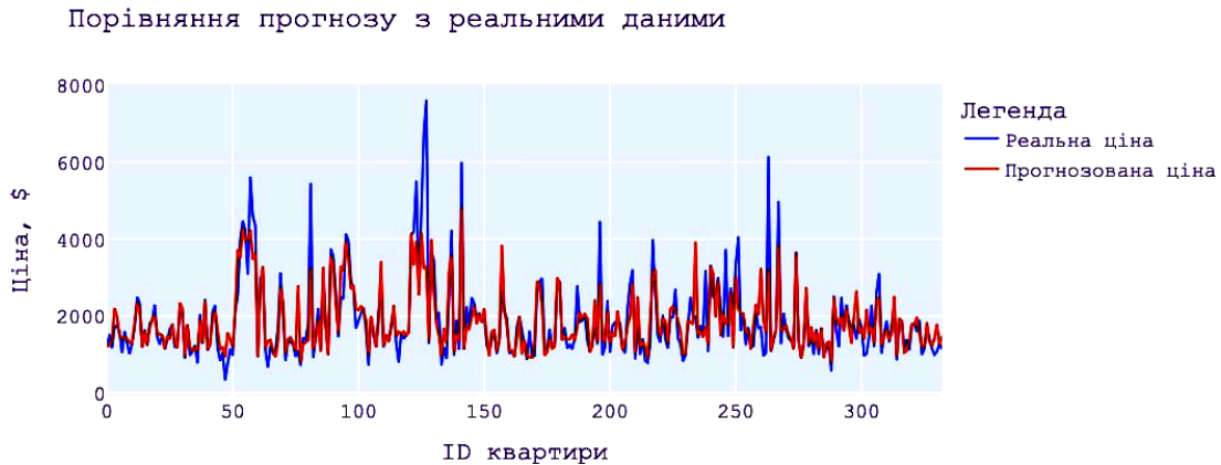
Рис. 2. Результат прогнозування вартості метра квадратного нерухомості залежно від її параметрів у місті Київ

Процес тестування важливий, оскільки надає можливість виявити та виправити помилки у системі на етапі її розроблення, а також допомагає зрозуміти, наскільки система готова до використання. Створено валідаційну вибірку даних про нерухомість та перевірено, як модель справляється із прогнозуванням вартості, порівняно з реальними даними.