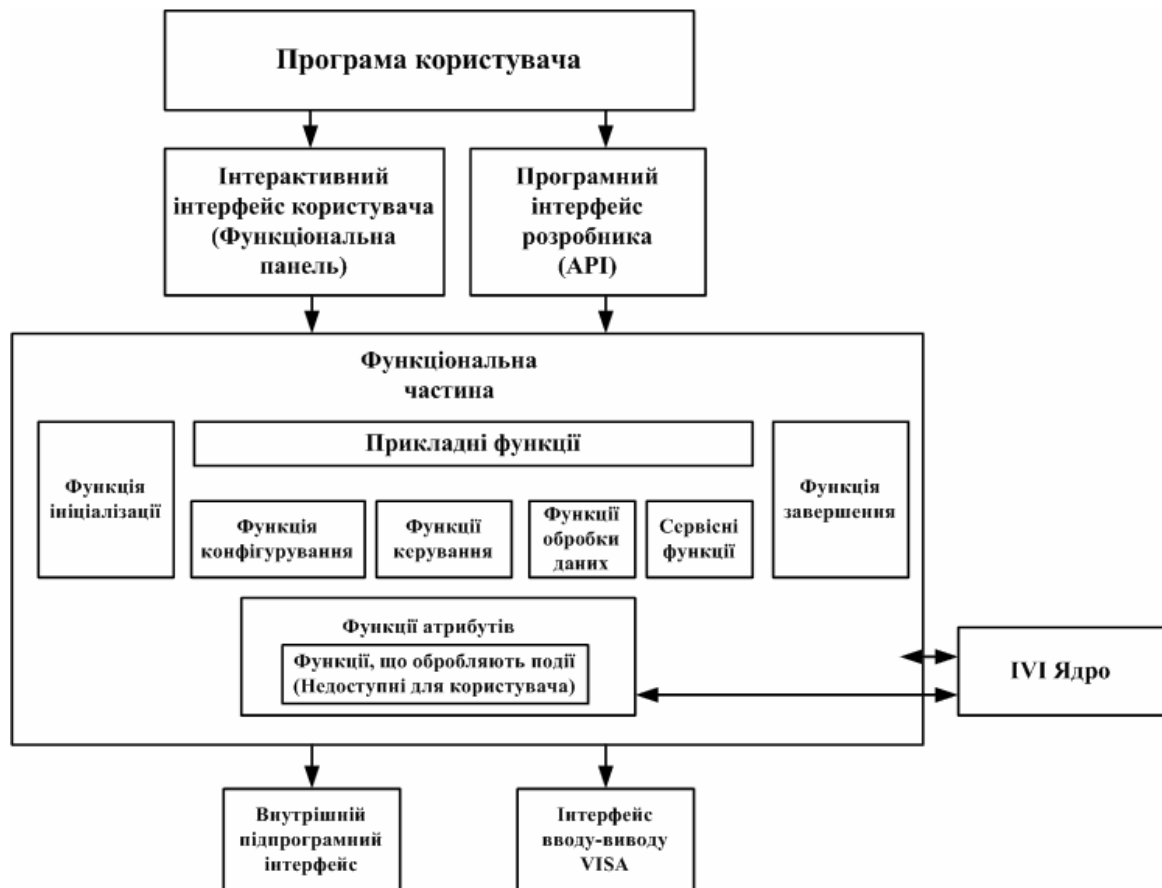
Рис. 1. Модель внутрішньої архітектури IVI – сумісного інструментального драйвера

До моделі внутрішньої архітектури входить набір функцій, які можна умовно поділити на три категорії: функції верхнього рівня, функції нижнього рівня та функції – обробники подій. Функції нижнього рівня реалізують специфічні для певного вимірювального приладу операції (наприклад, зміна рівня тестового сигналу (функція №1), перемикання діапазону (функція №2), перемикання тригера запуску вимірювання (функція №3) тощо). Функції верхнього рівня є фактично