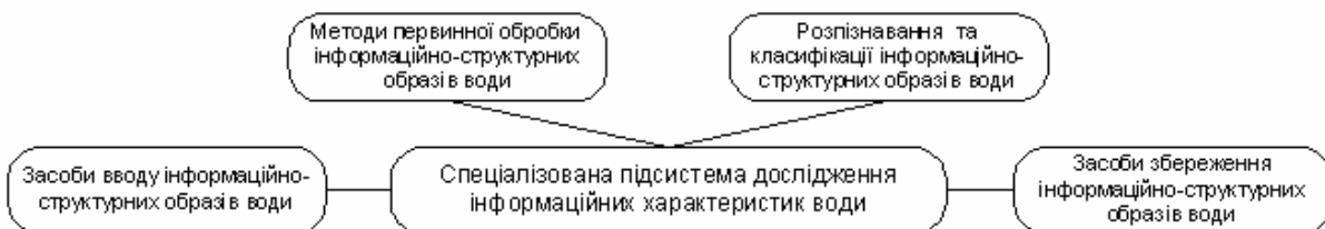
Рис.2. Структура програмного забезпечення спеціалізованої підсистеми дослідження інформаційних характеристик води

Для забезпечення максимально ефективного процесу дослідження якості води особливу увагу було зосереджено на розробленні структури програмного забезпечення. Структура програмного забезпечення спеціалізованої підсистеми дослідження інформаційних характеристик води наведена на рис.2.