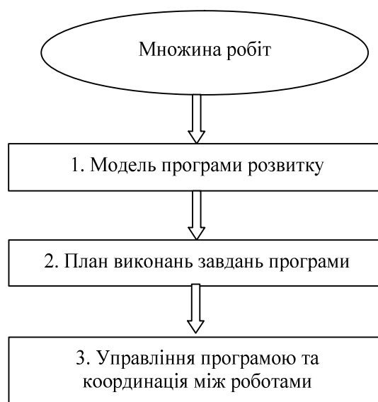
Рис. 3. Функціональна схема трирівневої моделі планування та управління програмою розвитку системи вищої освіти регіону

Організація підготовки фахівців з мінімізацією витрат на підготовку та підтримку якості трудових ресурсів регіону.