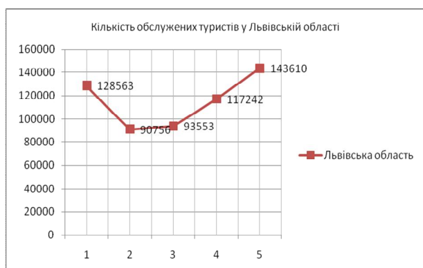
Рис. 1. Зміни числа туристів у Львівській області (2004–2008 рр.)

Зобразимо зміни числа туристів для Львівської області та для України із використанням засобів табличного процесора MS Excel: