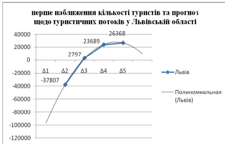
Рис. 3. Залежність, яка може бути використана для прогнозування туристичних потоків у Львівській області (екстраполяцією)