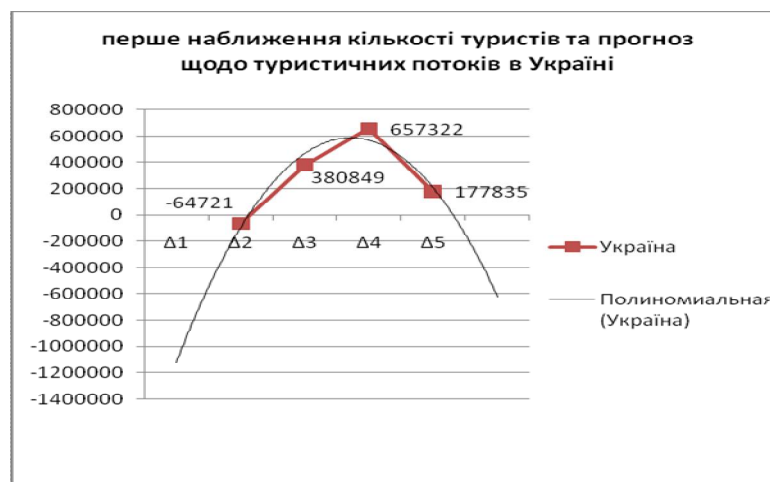
Рис. 4. Залежність, яка може бути використана для прогнозування туристичних потоків в Україні (екстраполяцією)

Результати аналізу загального обсягу туристичних потоків J_N (рис. 3 і рис. 4, отримані на основі даних табл. 1) свідчать про неперервні монотонні зміни туристичних потоків у Львівській області та Україні, починаючи з 2006 р. Максимуми потоків туристів спостерігаємо у 2007 р. Знайдені значення метрологічних чисел у стаціонарних станах ( i , відповідно, потоків) можна використовувати для прогнозування туристичних потоків на найближчі роки.