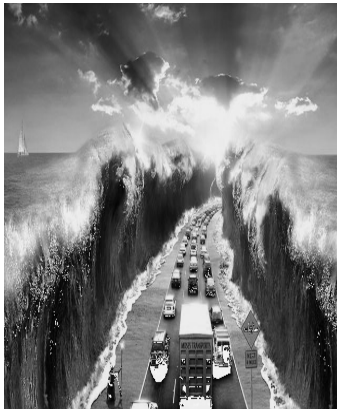
Рис. 6. Дешифроване зображення