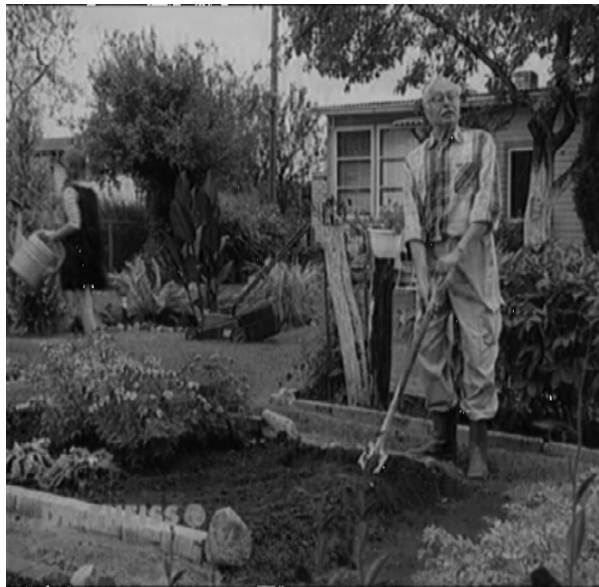
Рис. 3. Дешифроване зображення