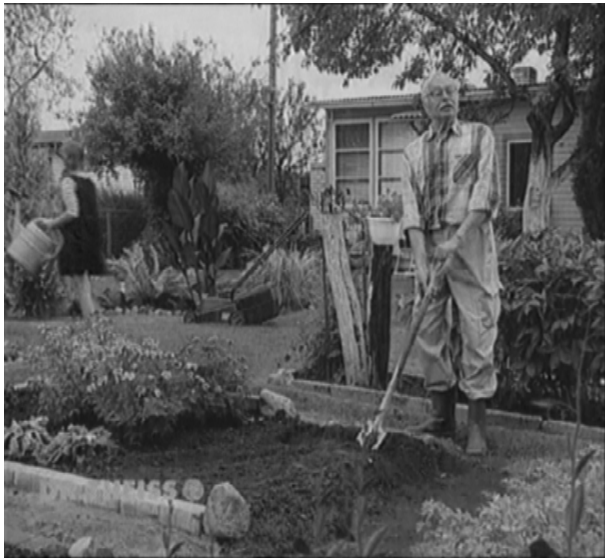
Рис. 1. Початкове зображення