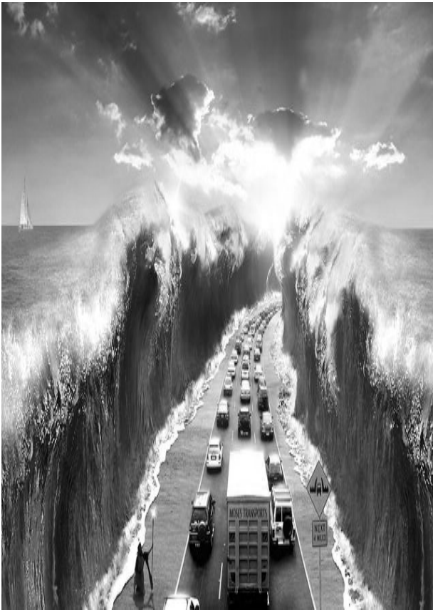
Рис. 4. Початкове зображення