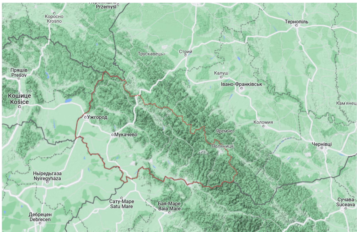
Рис. 2. Карта Закарпаття

Цю географічну різноманітність можна брати до уваги під час упровадження концепції розумного регіону, наприклад, використати геопросторові дані для кращого управління природними ресурсами та транспортною інфраструктурою. Водночас вона спричиняє виклики, такі як нерівний доступ до цифрових технологій або їх використання в гірських умовах [18].