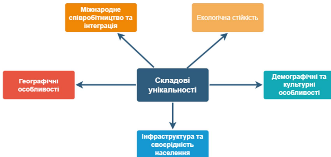
Рис. 3. Складові унікальності Закарпаття