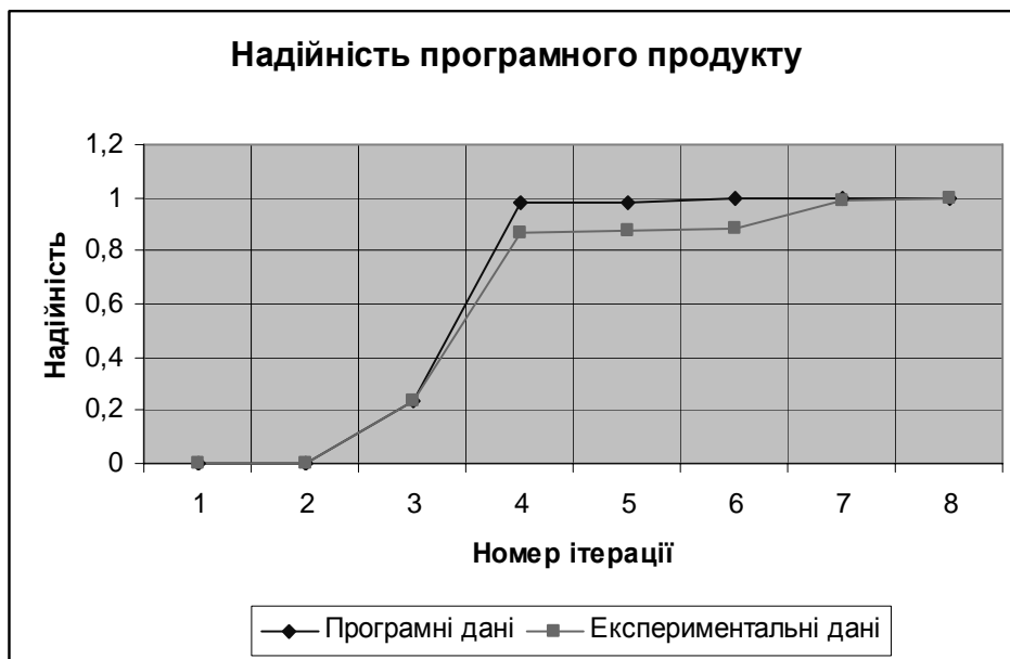
Рис. 3. Графік зростання надійності програмного продукту

Порівняння експериментальної та програмно визначеної надійності представлено на рис. 3. Як видно з графіків, після четвертої ітерації тестування надійність програмного продукту прямує до 1, що дає змогу характеризувати програмний продукт як надійний.