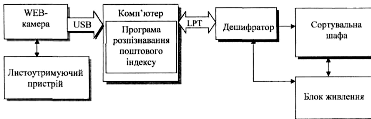
Рис. 1. Структура системи напівавтоматичного сортування

Виходячи з технічних умов сортування поштової кореспонденції, було розроблено систему напівавтоматичного сортування листів, узагальнену структуру якої наведено на рис. 1.