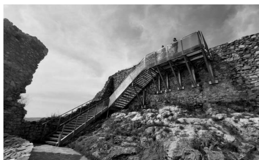
Рис. 5. Сучасні прибудови для експонування руїн. Замок Давін, Братислава, Словаччина