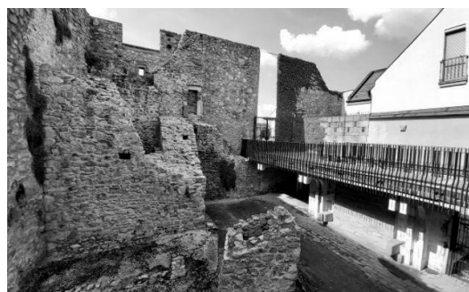
Рис. 6. Руїни, включені в простір міста. Вулиці міста, Братислава, Словаччина

У спеціалізованих закладах пам'яткові об'єкти переважно консервували і обладнували додатковими конструкціями для огляду (рис. 5). Руїни ж у межах міст рідше виділяли в окремий «експонат», частіше їх перетворювали на елемент середовища – наприклад, вплітаючи в ансамбль вулиці чи площі (рис. 6). В археологічному парку Петронель-Карнунтум можна спостерігати цілий спектр підходів до експонування конкретних аспектів архітектурних решток – від консервації до віртуальної реконструкції (рис. 7–9).