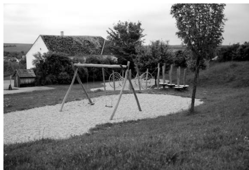
Рис. 2. Дитячий майданчик. Музей-село Нідерзульц, Австрія

Чудово продуманими є відпочинкові зони, які є невід'ємною частиною закладів, великих за площею. Деякі з них розташовуються у відмежованих зонах-«кишенях», деякі, навпаки, майстерно вплітаються в середовище, використовуючи наявні елементи, наприклад, залишки мурів. Одні використовують характер наявного оточення (рис. 3), інші створюють своє власне. Деякі поєднують кілька функцій, крім відпочинкової – наприклад, гастрономічну чи освітню (рис. 4).