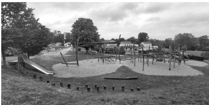
Рис. 1. Дитячий майданчик. Археологічний парк Петронель-Карнунтум, Карнунтум, Австрія

Крім того, цінова політика великих комплексів орієнтована на повторюване сімейне відвідування місцевими, тому наявність великої кількості дитячих майданчиків відрізняє місцеві заклади від українських (рис. 1, 2). Всі майданчики є стильово вплетені в концепцію та характер конкретного місця і стають повноправною частиною просторів. Важливим доповненням також є інклюзивність – вона забезпечує легкий доступ не лише сім'ям із візочками, але й людям з обмеженими фізичними можливостями. Особливістю, яка вирізняє відвідані нами європейські заклади від українських, – передбачена інфраструктура для вихову домашніх тварин.