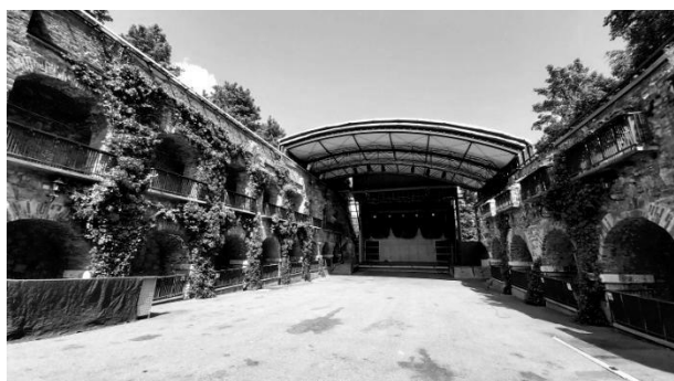
Рис. 10. Адаптація казематів з розміщенням сцени та місць для глядачів. Замок Шлосберг, Грац, Австрія