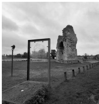
Рис. 8. Видова точка, з якої через нанесене на щит зображення можна побачити первісну форму об'єкта. Язичницька брама, Карнунтум, Австрія