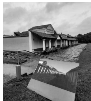
Рис. 9. Видова точка, з якої можна побачити віртуальну реконструкцію вулиці через мобільний додаток. Археологічний парк Петронель-Карнунтум, Карнунтум, Австрія