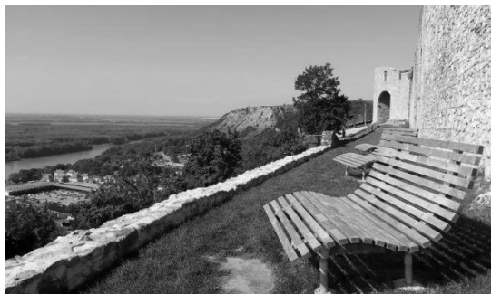
Рис. 3. Відпочинкова зона з видом на місто. Замок Хайменбург, Хайнбург на Дунаї, Австрія