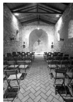
Рис. 11. Каплиця, обладнана для проведення лекцій. Замок Хайменбург, Хайнбург на Дунаї, Австрія

Інноваційний підхід до переформатування музею як інтерактивного, спільного досвіду під відкритим небом розширяє культурну інклюзивність. Створення інтерактивних мистецьких інсталяцій, розміщених у громадському просторі, активно залучає відвідувачів у творення власного досвіду і кидає виклик звичайним музейним типологіям. Використання мультимедійних інтерактивних елементів пропонує нові перспективи у збагаченні громадських просторів. Завдяки інтеграції цифрових технологій, мистецьких практик, технік оповідання та методології участі вони сприяють динамічному та захопливому досвіду для відвідувачів, дослідженню та збереженню культурної спадщини місця та заохочують активне залучення громадськості до культурної спадщини (Mantzou, Bitsikas, & Floros, 2023). Найбільший інтерес для реалізації методу «доповненої реальності» викликає сьогодні створення тривимірних моделей об'єктів на екранах смартфонів, планшетних комп'ютерів чи інших перспективних пристроїв. Ці технології створюють можливість організації інтерактивного середовища всередині музейного простору, зацікавлюють та долучають до відвідування музеїв більше публіки (Проненко, 2017).