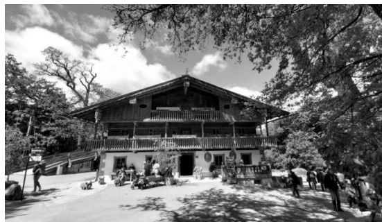
Рис. 4. Перенесений тірольський будинок з експозиціями інтер'єрів та кафе всередині. Зоопарк палацово-паркового комплексу Шоннбрунн, Відень, Австрія