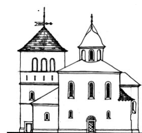
Рис. 4. Реконструкція вигляду будівлі Спаського храму (Петрик, 2021)

Рефлексивним видом можна вважати спробу реконструкції вигляду будівлі, що міститься у статті В. Петрика «Побачити минуле», котра розміщена на порталі «Збруч» (Петрик, 2021) (рис. 4). За основу тут взято згадані вище описи кінця XVIII ст. На момент написання цієї статті така реконструкція була єдиною спробою такого роду у сучасному опрацюванні цієї теми. Хоча деякі з цих припущень мають дискусійний характер, у межах цієї статті всі вони відіграють роль емпіричного підґрунтя.