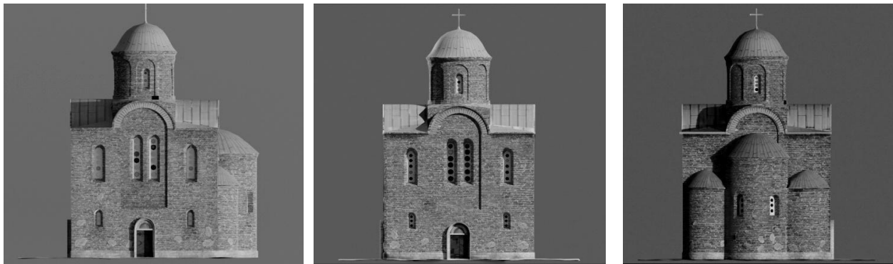
Рис. 9. Пропозиція із відтворення зовнішнього вигляду первинної будівлі храму Преображення у с. Спасі

Збережені описи однозначно стверджують, що матеріалом будівництва була цегла, однак опис №V згадує «добрий кам'яний і цегляний матеріал», що можна інтерпретувати як цегляну кладку із вставками з каменю. Це, загалом, узгоджується із припущенням І. Мицька, про зведення храму будівничими із Волковийська, котрі належали до Городенської (Гродненської) архітектурної школи. Разом з тим, такий тип мурування є універсальним для всієї візантійської ойкумени, а в давньоруському будівництві асоціюється із «київською школою», про що у свій час згадував В. Вуйцик. У межах наведеного тут відтворення ця фраза також інтерпретується як наявність кам'яного підмурівку, який присутній на пропозиції реконструкції зовнішнього виду споруд на межі ХVІІІ–ХІХ ст., наведеної у статті В. Петрика. Звідси також було взято пропозицію щодо висоти головної брили споруди.