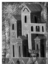
Рис. 3. Спаський храм на іконі Поклоніння Волхвів з с. Бусовиська середини XVI ст.