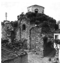
Рис. 5. Храм Παναγία Παντοβασίλισσα поч. XIV ст. у Τρίγλει

На основі наведеного аналізу можна провести виокремлення даних для відтворення , які можна поділити на історіографічні, інтерполяційні та архітектонічні. До першого виду варто віднести рефлексії, котрі стосуються обставин виникнення храму. Наприклад, у міркуваннях І. Мицька вартим уваги є акцент на зв'язку генези храму із традицією східнохристиянської містичної духовності, які передовсім впливають із літописних свідчень. Зокрема, в контексті життя князя Войшелка, що фігурує як передбачуваний будівничий спаського храму. Прямуючи на Святу Гору (Афон), він змушений повернутись назад (Літопис, 1989) і саме із цим, ймовірно, пов'язана ідея розбудови обителі «афонського» типу на Самбірщині. Хоча перебіг та інтерпретація цих подій можуть бути різними, для проблеми відтворення первинного вигляду храму ці дані мають значення з точки зору розуміння ідеалів тогочасного локального соціуму, котрі відображались на характері створюваного ним матеріального довкілля. Тож вигляд храму, який мав бути втіленням містичної традиції ісихазму, можна пов'язувати із аналогами умовного «афонської типу».