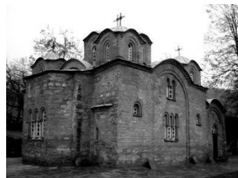
Рис. 7. Храм Αγίου Παντελεήμονα у Нерезі