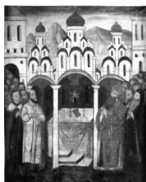
Рис. 2. Спаський храм на іконі Богородиці 1659 р. із церкви св. Юрія у Дрогобичі