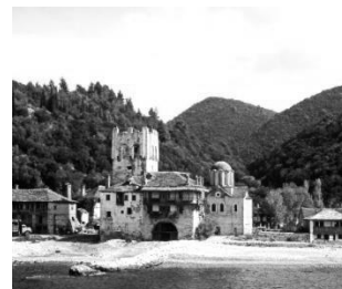
Рис. 8. Прибережний ансамбль Μονή Ζωγράφου

В зв'язку із цим, інтерполяційні дані виглядають як окреслення схожості просторового укладу Спаського монастиря з аналогами регіону Святої Гори та, в ширшому сенсі, пізньовізантійського простору. До таких аналогів можна віднести, зокрема, храми Παναγία Παντοβασίλισσα початку XIV ст. у Τρίγλει (рис. 5), Αγίου Παντελεήμονα XIV ст. у Салоніках (рис.6). Для цих та інших подібних будівель характерною є відсутність бічних закомар, домінування центрального купола і відносно невеликі розміри. Така структура є продовженням більш давньої традиції, яка, зокрема, простежується у храмі Αγίου Παντελεήμονα у Нерезі (рис. 7). Про зв'язок Спаського монастиря з традицією Святої Гори також може свідчити наявність високої окремо поставленої вежі, котра відігравала як роль дзвіниці, так і спостережно-оборонної структури. Починаючи з IX–X століття, такого роду вежі стали невід'ємним елементом ідентичності сакрального простору Афону (Kouçis та ін., 2021). Прикладом композиційної подібності Спаської обителі на Самбірщині з ієротопією Святої Гори є прибережний ансамбль Μονή Ζωγράφου, який сформований з трьох рукотворних елементів – однобаневого храму, вежі та келій і природних – гірського пасма і берегової лінії (рис. 8).