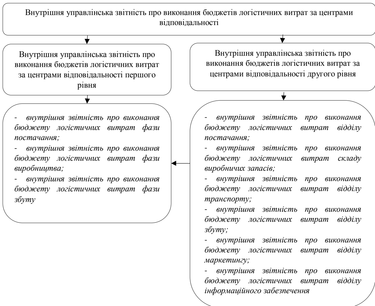
Рис. 2. Склад внутрішньої управлінської звітності щодо логістичних витрат підприємства

У сучасній управлінській практиці важливим інформаційним ресурсом у характеристиці витрат є їх поділ на такі, що артикульовані як ефективні та реальні. Тому у формах управлінської звітності доцільно було б наводити дані про витрати, пов'язані з найефективнішою сукупністю угод логістичного виду, за наявної на тогочасний період системи суспільних інститутів (рис. 2). Величина відхилення реальних витрат від ефективних показує, наскільки ефективно логістична компанія використовує встановлені економічні зв'язки та інститути. Відхилення реальних витрат від ефективних зумовлено, з одного боку, асиметрією інформації, що циркулює між економічними агентами, а з іншого – можливістю отримання окремим економічним агентом більшого виграшу тоді, коли він відмовиться виконувати встановлені правила та норми.