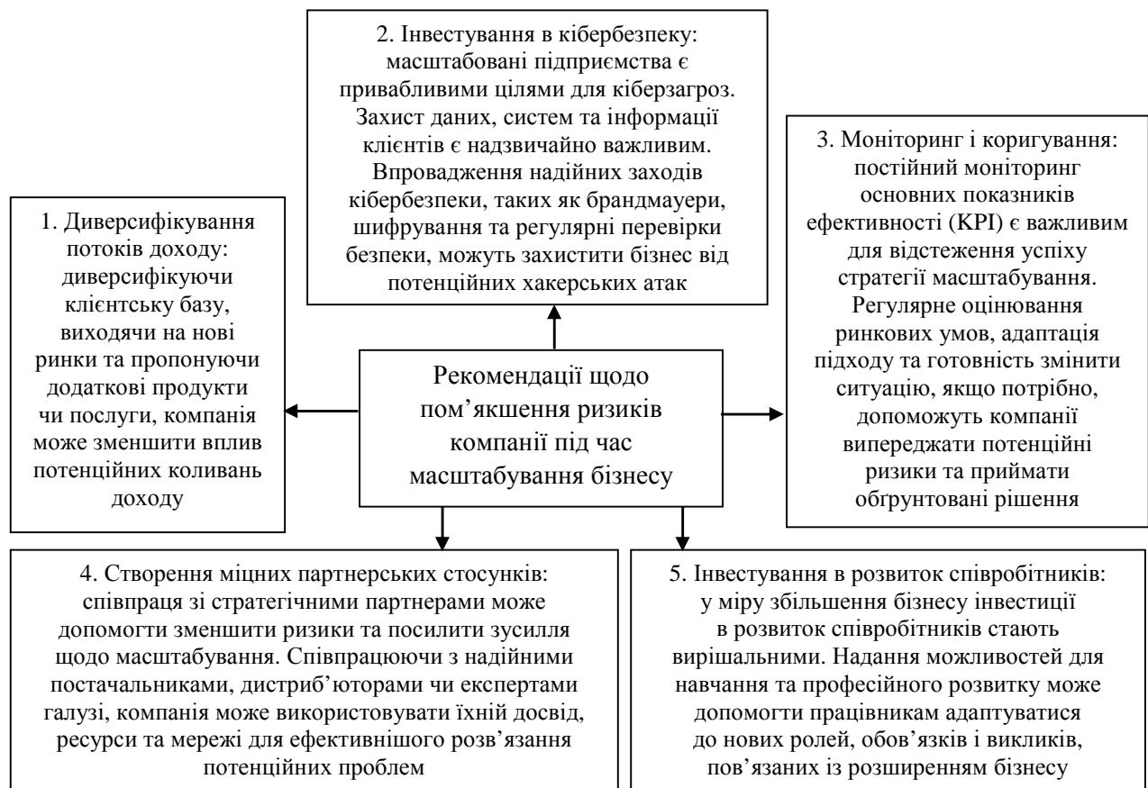
Рис. 2. Рекомендовані заходи щодо пом'якшення ризиків компанії під час масштабування бізнесу

Для пом'якшення ризиків компанії мають прийняти проактивний підхід і впроваджувати стратегії управління ризиками (рис. 2).