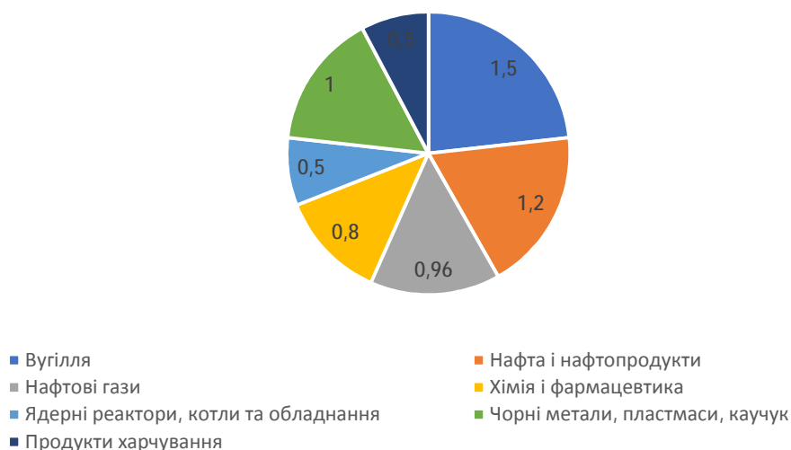
Рис. 3. Вартість імпорту продукції з росії, млрд дол.

Енергетичний імпорт з рф – основна проблема для України. Саме тут країна найбільш залежна від агресивних сусідів – рф і білорусі. Першими з початку війни це відчули українські мережі АЗС. На ці дві країни торік припало понад 60 % поставок дизельного пального і половина всього бензину. Поставок звідти з відомих причин немає.