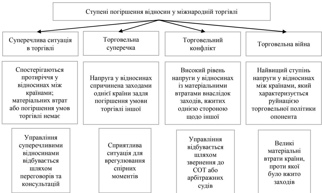
Рис. 2. Ступені погіршення торговельних відносин між країнами [3]

Важливо розуміти відмінність понять “конфлікт”, “суперечка”, “суперечлива ситуація” і “війна” в ракурсі використання у сфері міжнародних торговельних відносин (рис. 2).