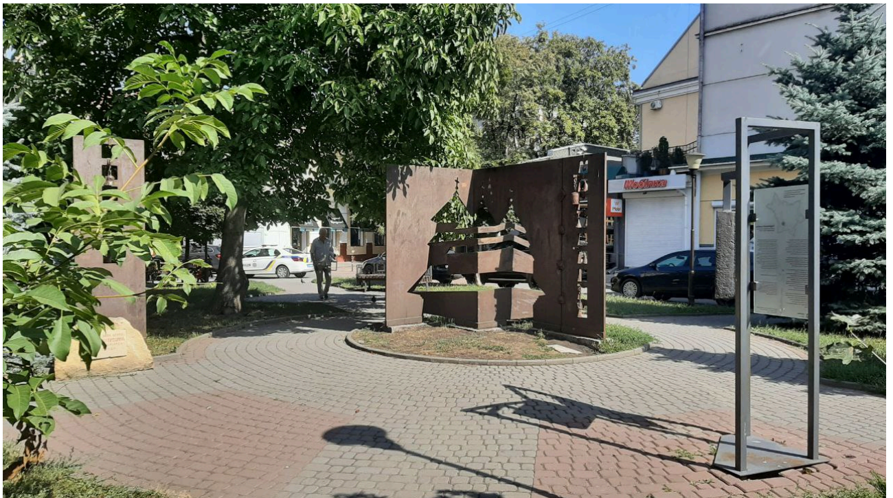
Рис.4. Об'ємно-просторове ознакування втраченої церкви Воскресіння (XVII ст.) у м. Івано-Франківську. Вигляд зі сторони площі Ринок.