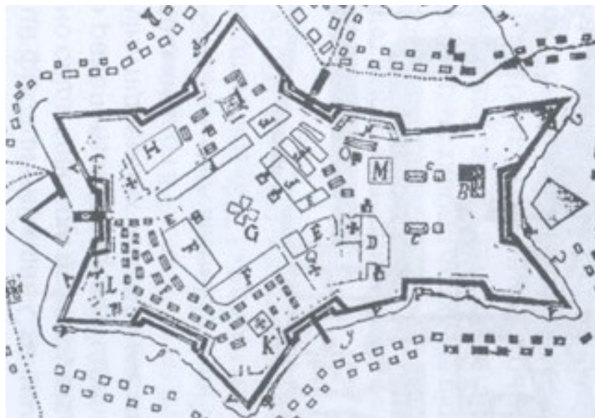
Рис.2. План Станіславівської фортеці 1760 рр., (фрагмент), на якій літерою "К" позначено українську греко-католицьку церкву.