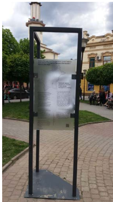
Рис.7. Об'ємно-просторове ознакування втраченої церкви Воскресіння (XVII ст.) у м. Івано-Франківську. Інсталяція із бронзовою копією наріжного каменя церкви Воскресіння. Скляна інформаційна таблиця до інсталяції наріжного каменя церкви.

На час створення проекту ця територія не використовувалась, сквер був фактично закинутим та відігравав роль дисгармонійного елемента у просторі історичного ядра міста.