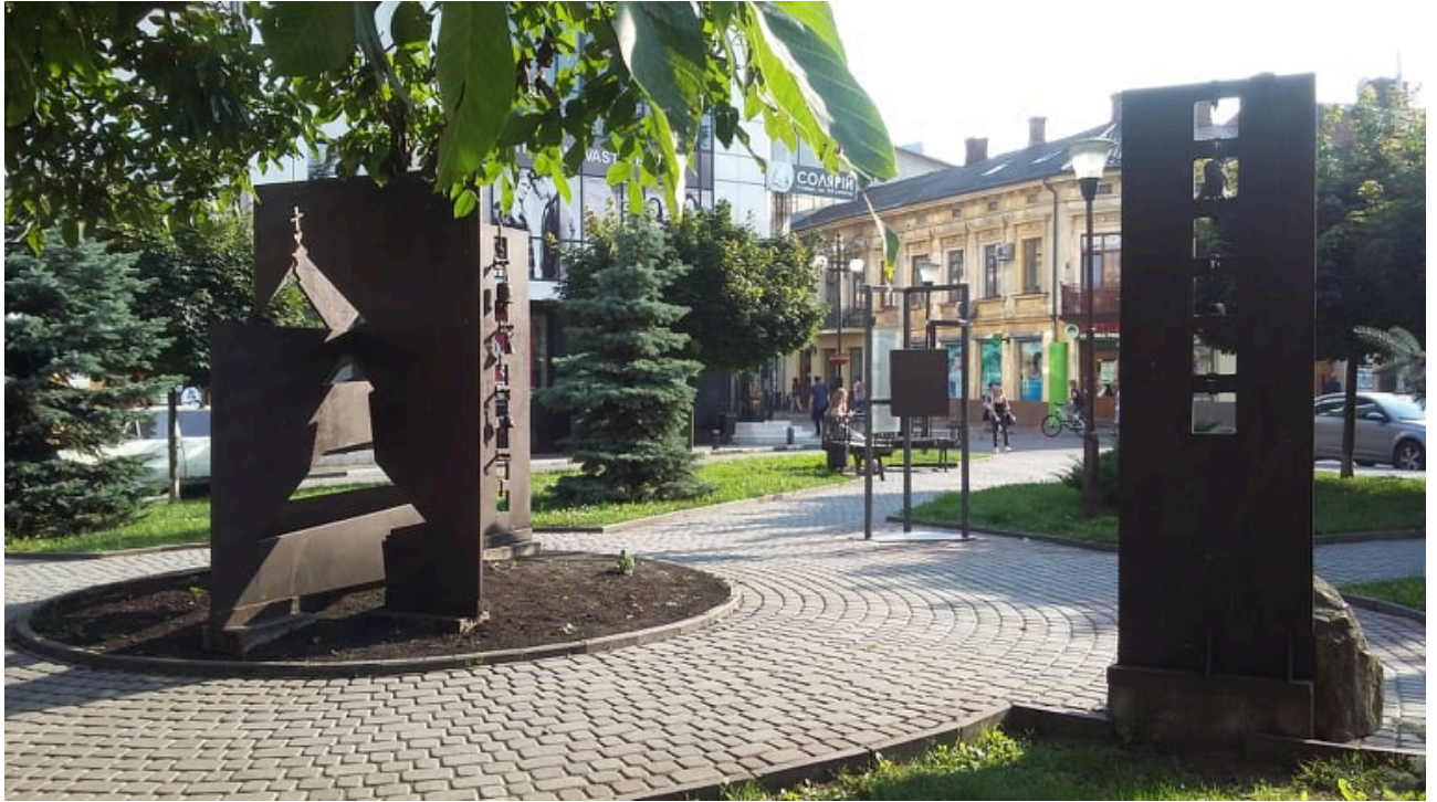
Рис.5. Об'ємно-просторове ознакування втраченої церкви Воскресіння (XVII ст.) у м. Івано-Франківську. Вигляд зі сторони вул. Вірменської. Фото автора.