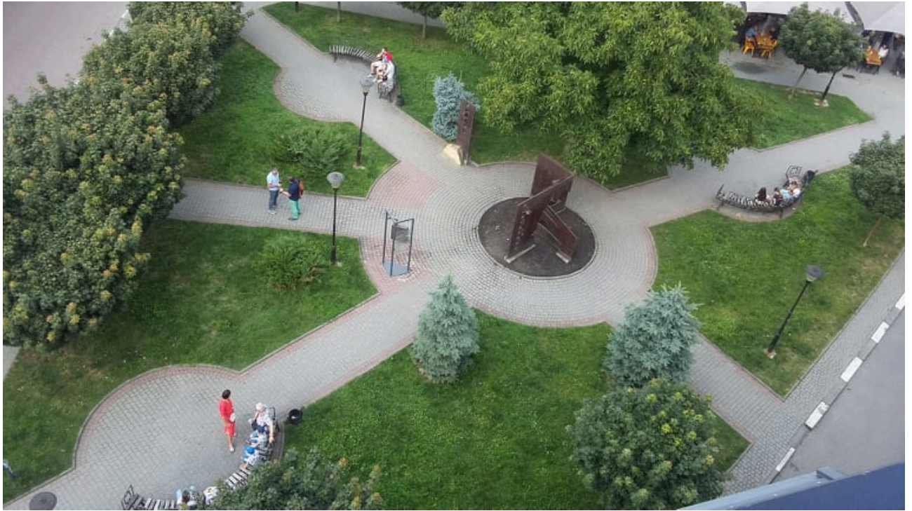
Рис.3. Об'ємно-просторове ознакування втраченої церкви Воскресіння (XVII ст.) у м. Івано-Франківську. Вид зверху.

фактично це збірний образ відомих у регіоні народних дерев'яних сакральних споруд. Композиція виконана із монолітних плит кортєнівської сталі, яка є стійкою до атмосферних впливів та корозії, що забезпечує довговічність конструкції (Рис. 4 - 7).